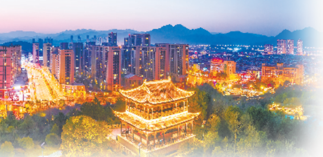
浦江城区夜景