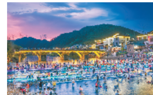
大畈乡上河村夜景