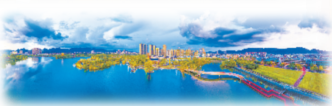
焕然一新的金狮湖