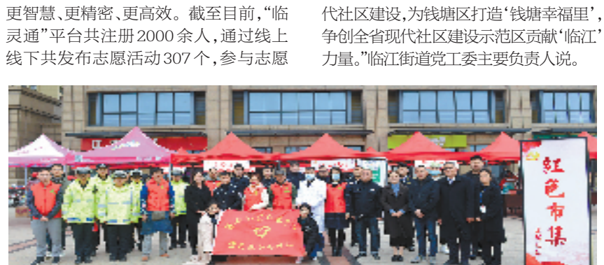
临江街道高新社区定期开展“红色市集”活动

“人文关爱工程”,联合辖区教育机构推出“育儿关爱工程”等,以贴心服务温暖产业工人群体。 2021年起,临江街道探索以数字赋能社区治理,开发数字化场景应用“临灵通”,促进新临江人更好地融入社区。 今年,临江街道将继续以智慧化、融合化为导向,围绕解决企业职工、社区居民高频使用、高关注度、高获得感的事项,重新梳理核心需求,升级和完善了“临灵通”功能,添加了“点赞临江”“活动中心”“邻里互助”“工具箱”等板块,以多元化、易操作的应用场景带动社会治理