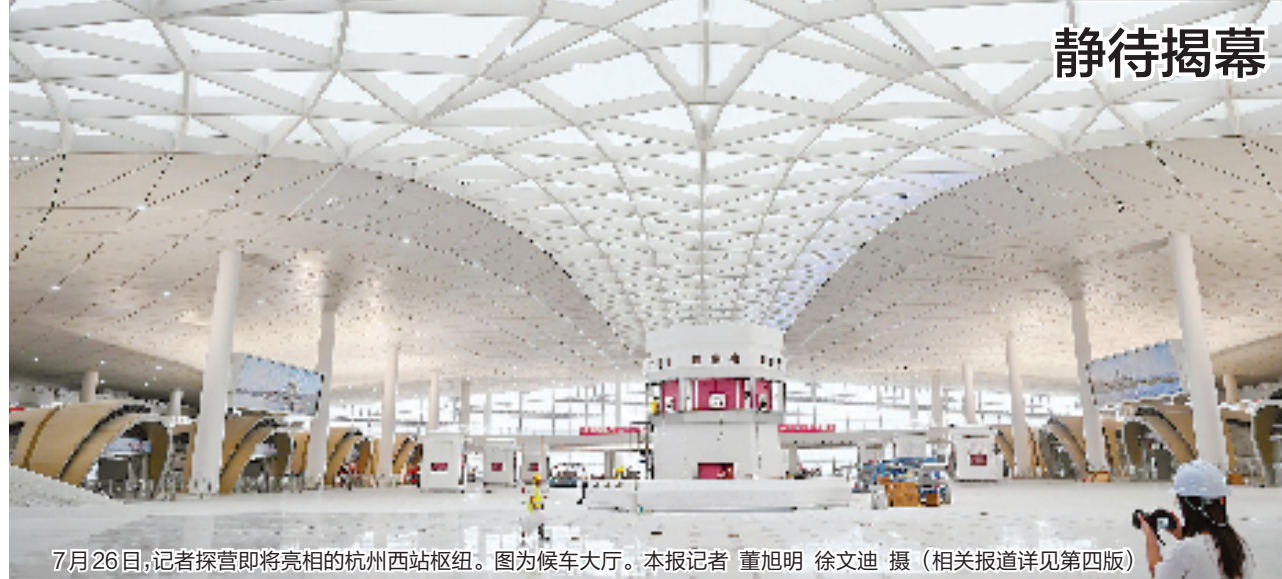
7月26日,记者探营即将亮相的杭州西站枢纽。图为候车大厅。(相关报道详见第四版)