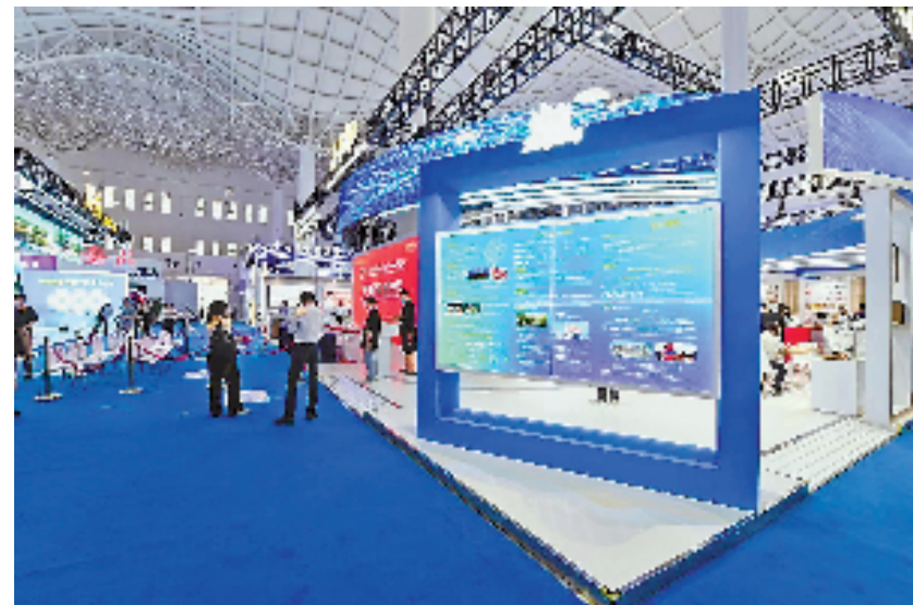
图为即将开馆的浙江主题馆。

据悉,浙江主题馆将一直展出到7月30日,其间各展位将有新品首秀、试吃试用、现场体验等互动推广活动。展会7月29日至30日对公众开放。