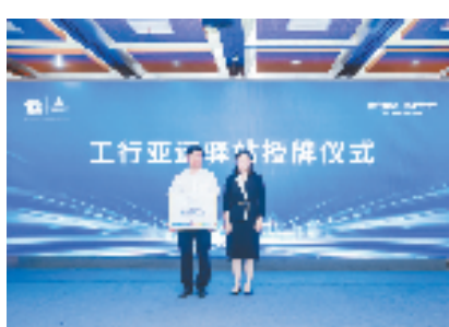
杭州首家银行“亚运驿站”亮相工行高新支行

杭州亚运会进入新一轮倒计时,接下来,工行杭州分行将有更多“亚运驿站”精彩亮相。“亚运驿站”也将成为工行网点的亮点,来工行办理业务的客户或是路过的市民、游客,都能到“亚运驿站”看一看、歇歇脚,感受“亚运时刻”下,金融属性与亚运文化的碰撞,为亚