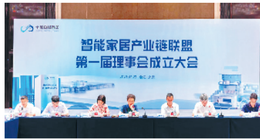
“浙江省智能家居产业链联盟”成立仪式

近年来,永康市把智能家居产业链作为全力打造的6条百亿级现代产业链之一,通过数字赋能、科技赋能,大力实施强链补链工程,推动行业数字化转型,营造产业创新生态,推动智能家居产业跨越式发展。目前该市拥有智能家居领域国家高新技术企业47家、省级企业技