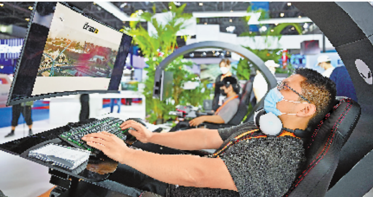
7月25日,参展商展示一款游戏太空舱。