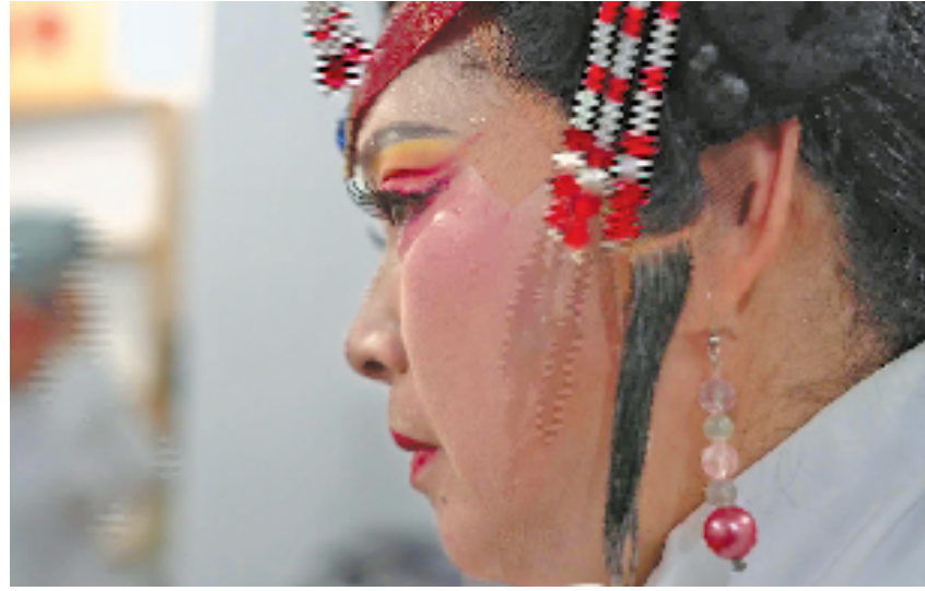
演员脸上冒出密密麻麻的汗珠。