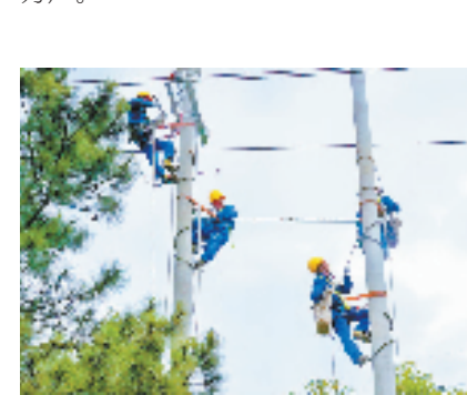
大有余杭分部施工人员进行变压器增容工作

查工作已是22时。迎峰度夏期间，从百米高空到城市地下，国网杭州市余杭区供电公司供电员工用辛勤的汗水，将“清凉”送到千家万户。