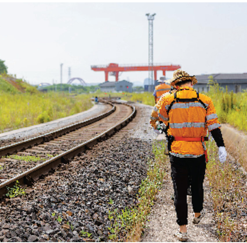
铁路湖州西站的调车员们全副武装顶着骄阳作业。