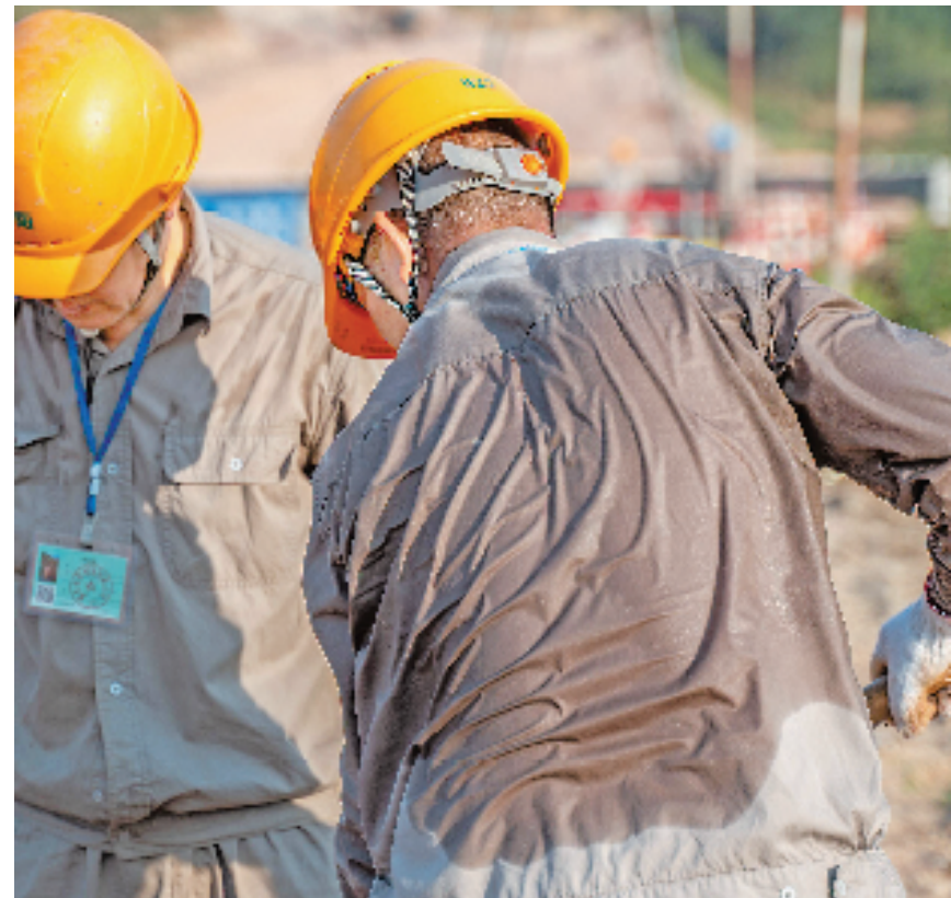
国网松阳县供电公司员工在进行立杆作业,用汗水守护居民夏日清凉。