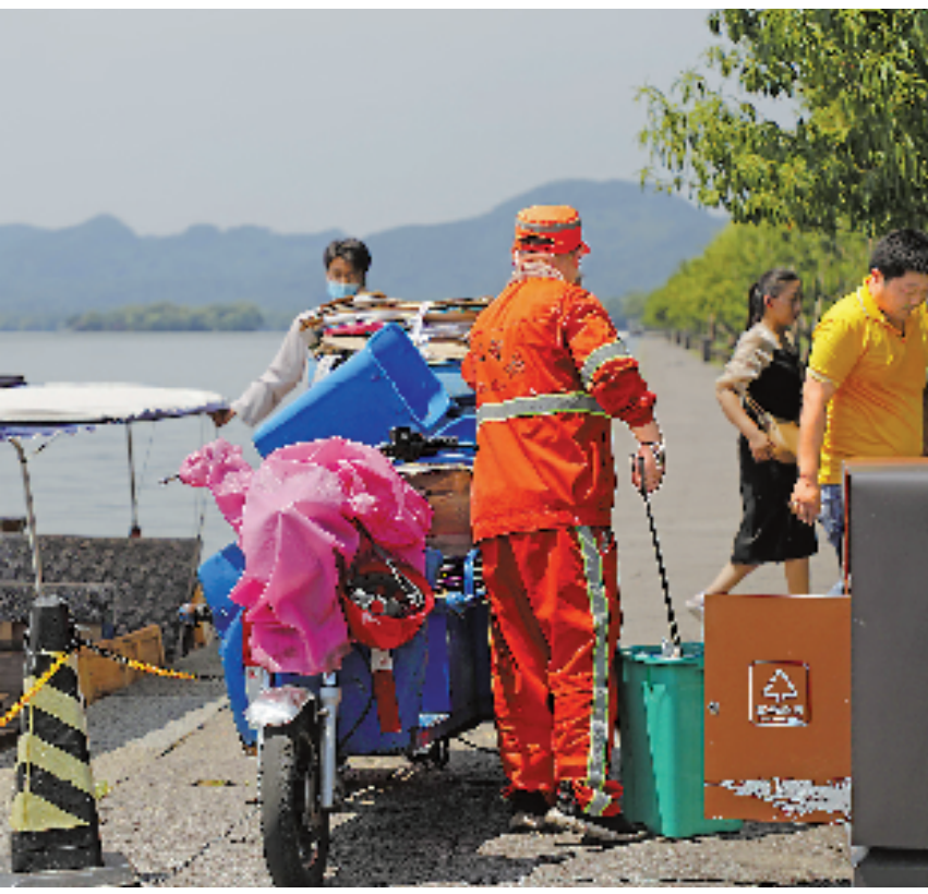
杭州一名环卫工人顶着烈日在西湖白堤上清理垃圾。