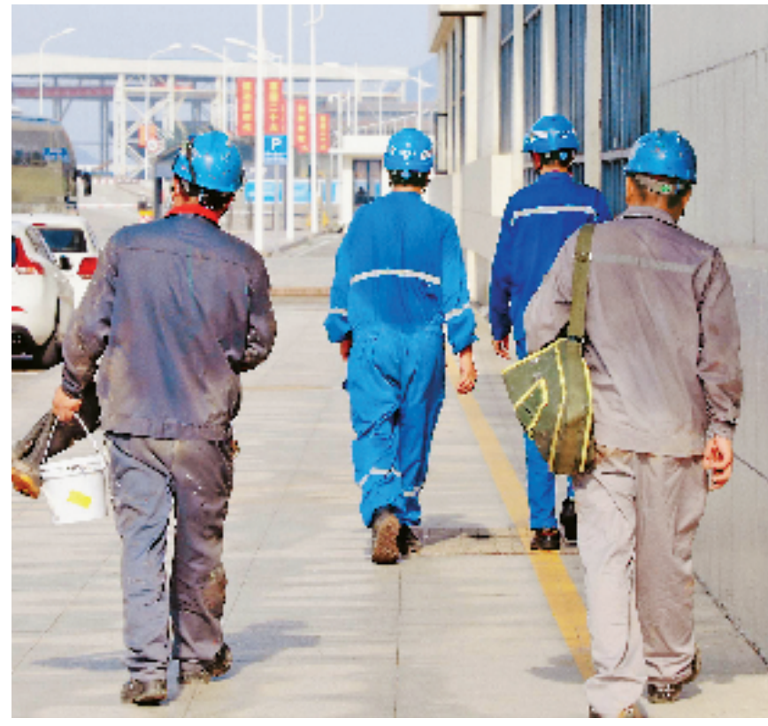
台州三门核电施工现场,工人们冒高温进行室外作业,确保工程建设有序推进。