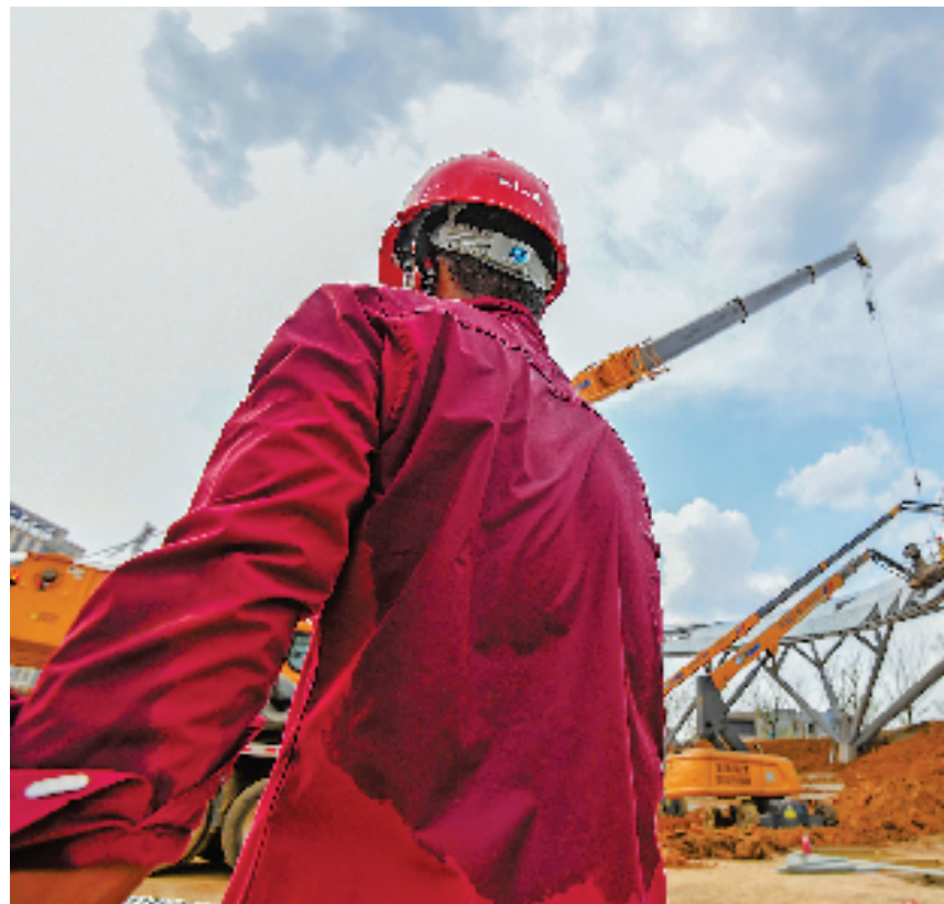
杭州市临安区人民广场改建项目工地上,施工人员战高温,奋战在一线。