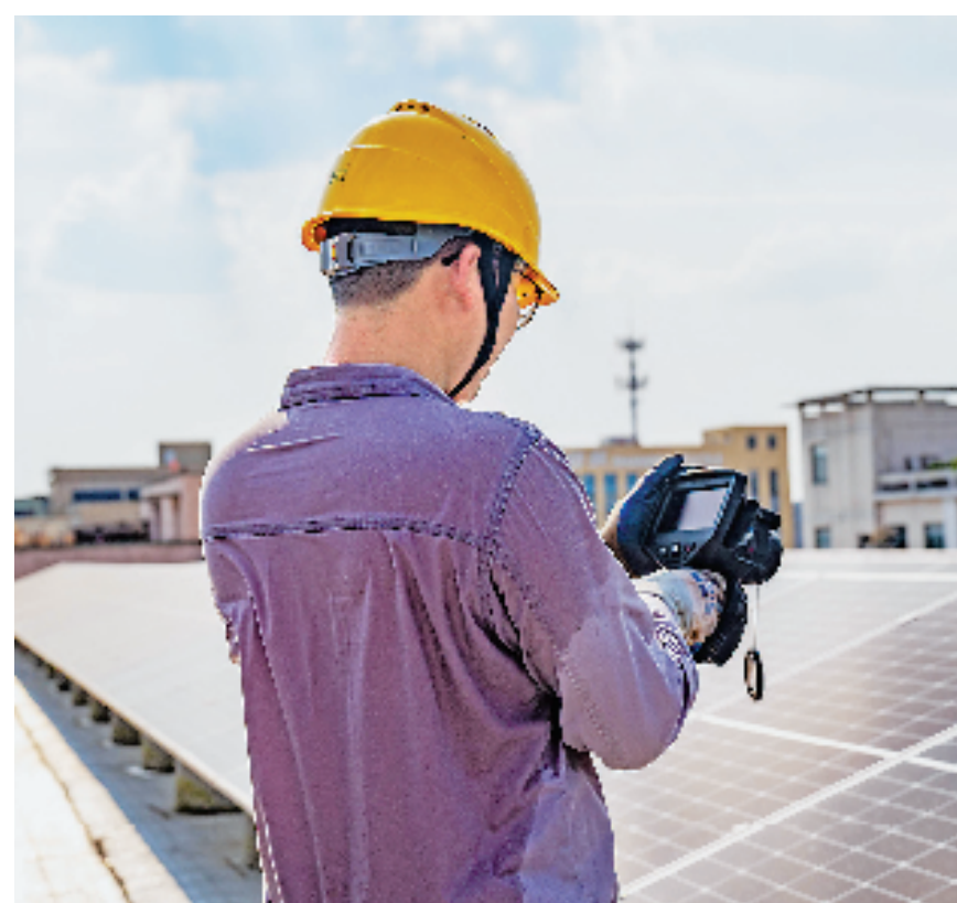
绍兴建元电力集团有限公司员工头顶烈日,对光伏站组件进行红外测温 and 牢固性检查。