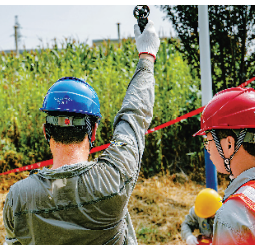
高温下,国网永嘉县供电公司工人完成带电作业后已是满头大汗,衣服湿透。