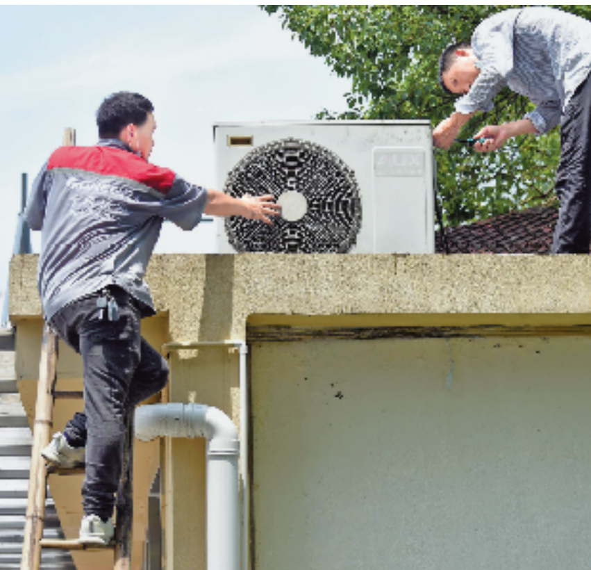
宁波市海曙区的两名空调维修工人头顶烈日在房顶检修室外机。