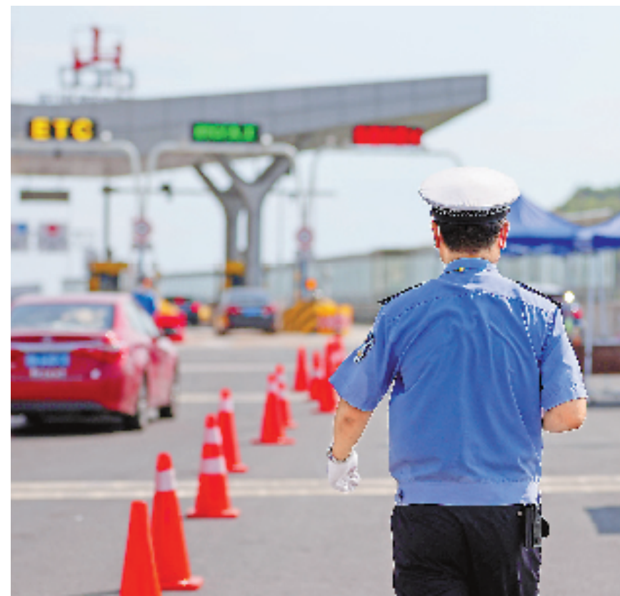
舟岱大桥双合执勤卡点,岱山县公安局交警大队一名交警的“湿身”背影。