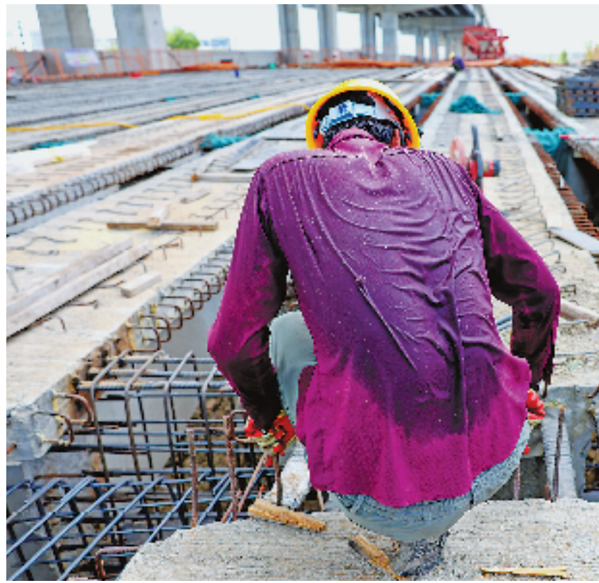
在余杭交通下属各建设工地,交通建设者们坚守岗位,用汗水浇筑一条条大路。