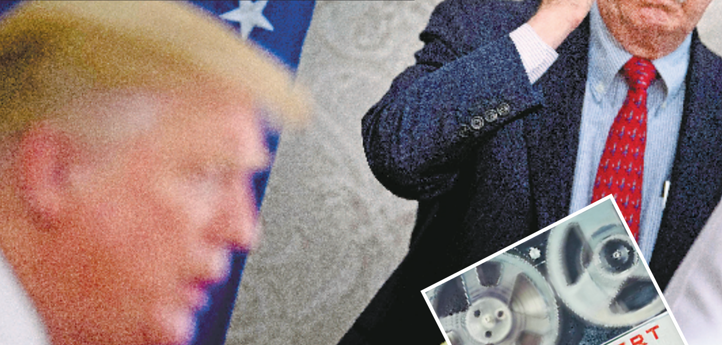
在美国华盛顿白宫,约翰·博尔顿(右)听取特朗普发表讲话(资料照片)。

挑动地区动荡、策划他国政变、干涉别国内政,美国多年来为维护自身霸权,对很多国家和地区输出动乱和灾难。不过,当一名美国前高官毫不避讳,也不以为错地当众承认这些“黑历史”,还是令人瞠目。 当地时间7月12日,在美国有线电视新闻网(CNN)播出的新闻访谈节目中,美国前总统国家安全事务助理约翰·博尔顿当场承认,自己作为美国官员曾协助在他国策划政变。 近日,美国国会举行一系列有关国会山骚乱事件调查工作的听证会。美国有线电视新闻网主持人杰克·塔珀就这一话题提问曾任特朗普政府的博尔顿。他自2018年4月起担任总统国家安全事务助理,直到特朗普2019年9月对外宣布博尔顿已在他要求下辞职。 和主持人讨论时,博尔顿说,他倒是认为“国会山骚乱”不算是特朗普精心策划的政变,毕竟特朗普的行事风格是“想一出干一出”。 当主持人反问,“难道只有特别聪明的人才能搞政变?”博尔顿“明帮暗贬”地说:“我曾协助策划政变,当然不是在美国国内搞事,而是在其他地方,搞这种事其实很费功夫的。这不是特朗普干的事。” 说出这番话时,博尔顿神态自若,丝毫也不觉得搞政变这事有何不妥。 主持人想要追问:“你提到自己是搞政变的行家……”博尔顿打断了他,回应道:“我拒绝提供更多细节。”他提及自己曾在著作中写到过2019年委内瑞拉发生的未遂政变。主持人说:“我认为有一些事情你没有告诉我。”博尔顿回答:“当然。” 博尔顿是美国政坛鹰派人物,以对外政策立场强硬著称,曾在里根政府、老布什政府、小布什政府中任职。2005年8月至2006年12月,他还担任过美国常驻联合国代表。 今年5月,美国前国防部长马克·埃斯珀在新出版的回忆录《神圣的誓言》中披露,特朗普政府当时曾与委国内反对派讨论,对委内瑞拉采取军事行动,甚至暗杀委总统马杜罗。埃斯珀2019年7月出任防长一职,与特朗普政见多有不合,于2020年11月遭特朗普解职。