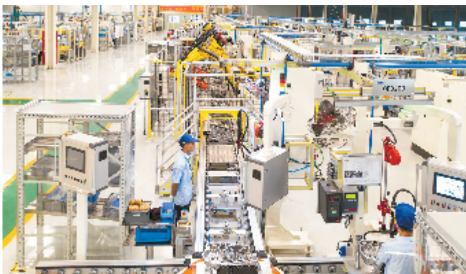
万里扬新能源驱动车间

曾经金华并没有光伏企业，2017年，光伏行业进入技术迭代关键期，需要拓展发展空间，金华瞄准了这一重大机遇，找到了龙头企业爱旭太阳能，根据企业融资和投资需求为企业量身定制招商方案。爱旭太阳能成功落地后，各大企业纷至沓来，如今金华光伏项目总投资超440亿元，打造了从硅片、电池片、组件再到辅材的全产业链。以同样的模式，金华在LED光电产业招大引强，打造了以半导体照明、智能光伏为主的全省最大信息光电产业集群。