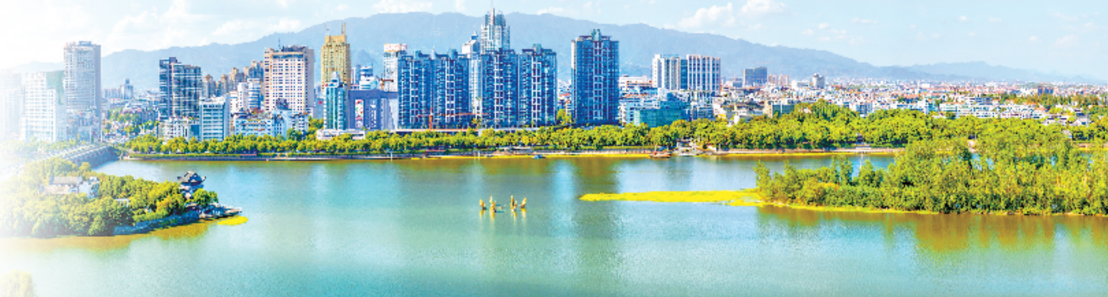
金华城市风貌