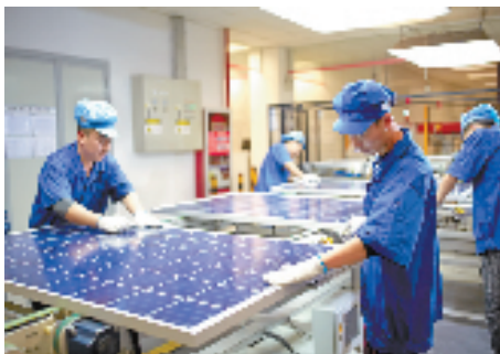
天合光能光伏组件生产