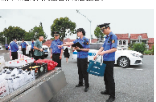
青吴嘉联合执法整治行动

在嘉善,推进跨区域协同监管。嘉善地处长江三角洲腹地,毗邻上海、江苏,破解长三角跨区域协同监管,影响深远。嘉善迭代升级“膳善汇”餐饮服务智慧监管平台,将全县99%的餐饮店纳入平台管理,通过隔油池液位传感器物联网感知技术掌握油污废水实时排放量、隔油池液位高低、窞井盖开启关闭状态等,实现实时预警、分析、处置,发现整改问题8400余个,投诉举报总量下降53%。