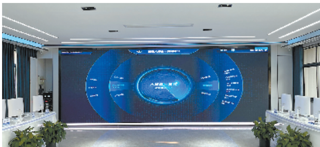
“一体化办案指挥中心”