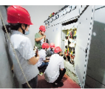
为用户免费安装用能宝

差，建议企业适当调整生产时间，加装储能等新型电力装置，充分利用谷电资源，降低用能成本；鼓励企业利用自有厂房屋顶及附属设施建设分布式光伏项目，并提供光伏发电运维业务，充分利用清洁能源实现节能减排目标。