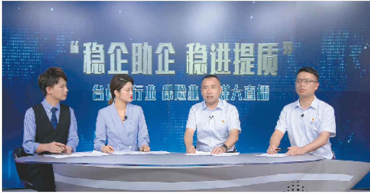
中行台州市分行分管负责人(右二)在台州稳经济直播活动中讲解惠企行动方案

临时性授信方案”，通过金融创新工具助力外贸企业渡过难关。截至目前，中国银行台州市分行已将8家优质企业纳入优选名单，为其中3家企业成功投放共计1155万美元。