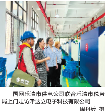
国网乐清市供电公司联合乐清市税务局上门走访达立电子科技有限公司