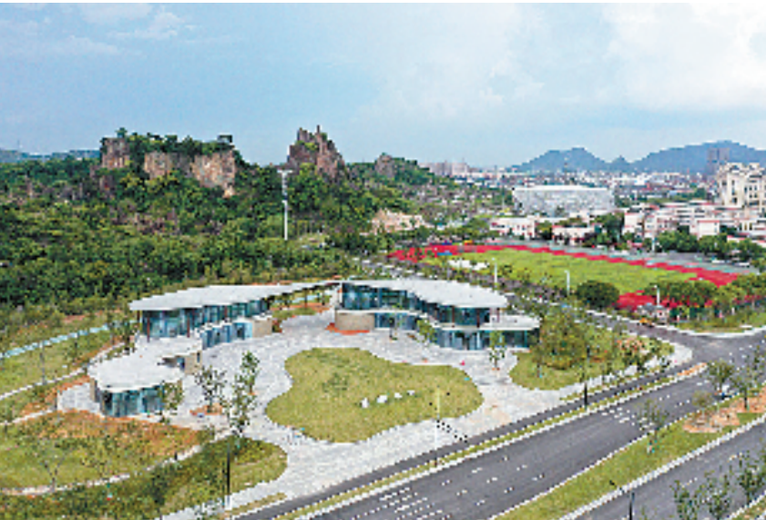
羊山区块和上方山大道环境综合提升工程

这些项目的快速推进,是柯桥经开区扩大对外开放、全面融杭接轨的一处缩影。近年来,柯桥经开区围绕打造“国际纺都智造中心、融杭湾区科创新城”,坚持内外兼修,除了提升交通硬件,着力推动杭绍“半小时通勤圈”更顺畅,更在提升城市功能品质,推进城市有机更新上下好功夫,致力建设更加开放包容,更加宜居宜业,更加活力美好的高能级大平台。