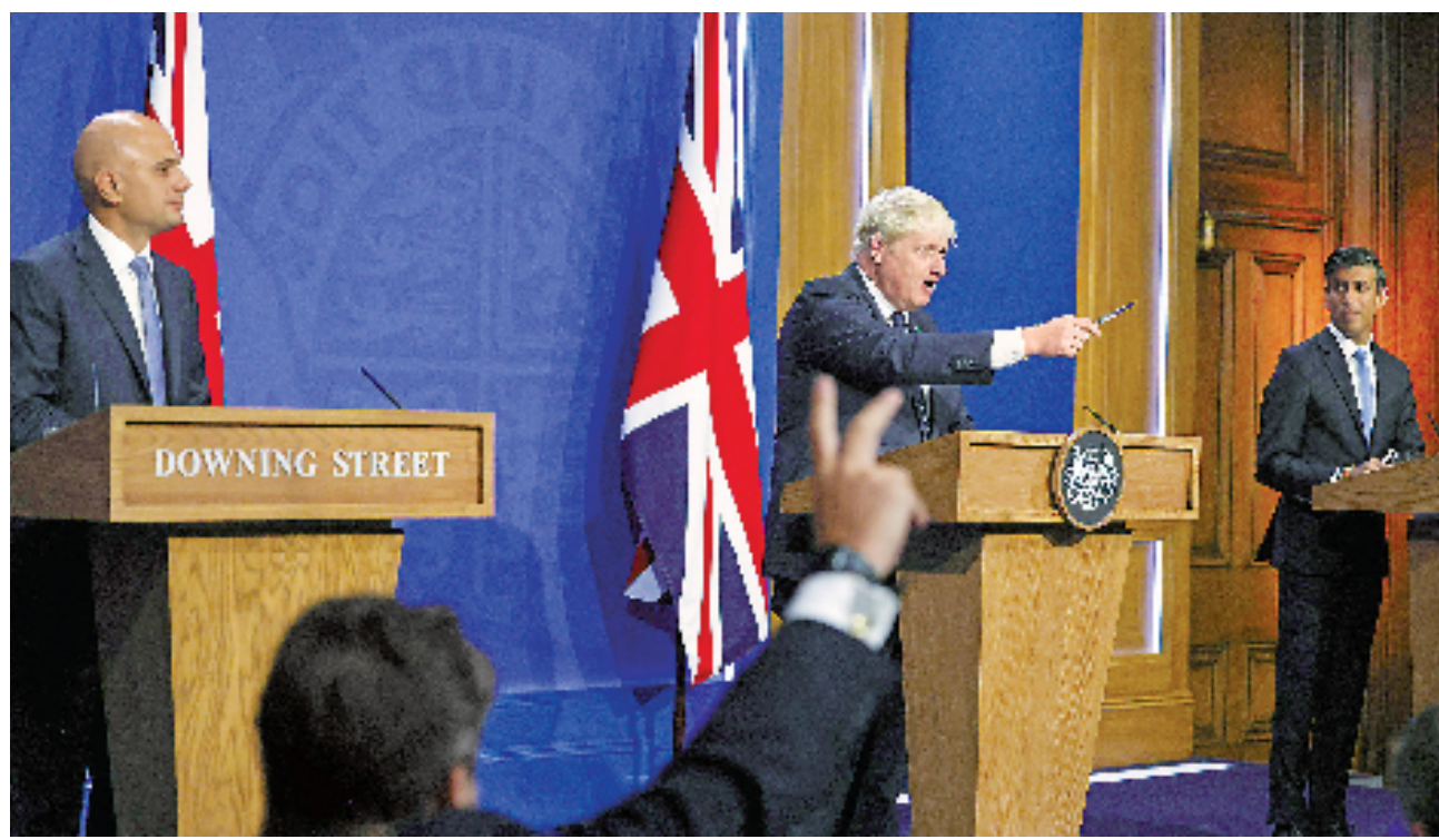
英国卫生大臣贾维德和财政大臣苏纳克7月5日辞职,首相约翰逊随后任命他们的继任者。图为2021年9月7日,约翰逊(中)、贾维德(左)和苏纳克在伦敦出席新闻发布会(资料照片)。

约翰逊5日晚些时候分别任命兰开斯特公爵郡大臣兼内阁办公厅大臣史蒂夫·巴克利接任卫生大臣、教育大臣纳齐姆·扎哈维接任财政大臣。