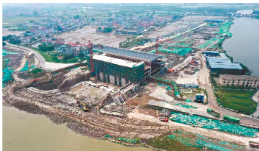
马山闸强排及配套河道工程