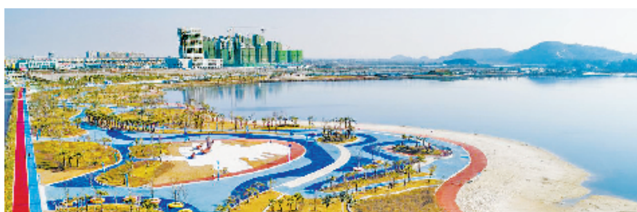
台州湾经济技术开发区白沙湾海滨公园 孙金标 摄