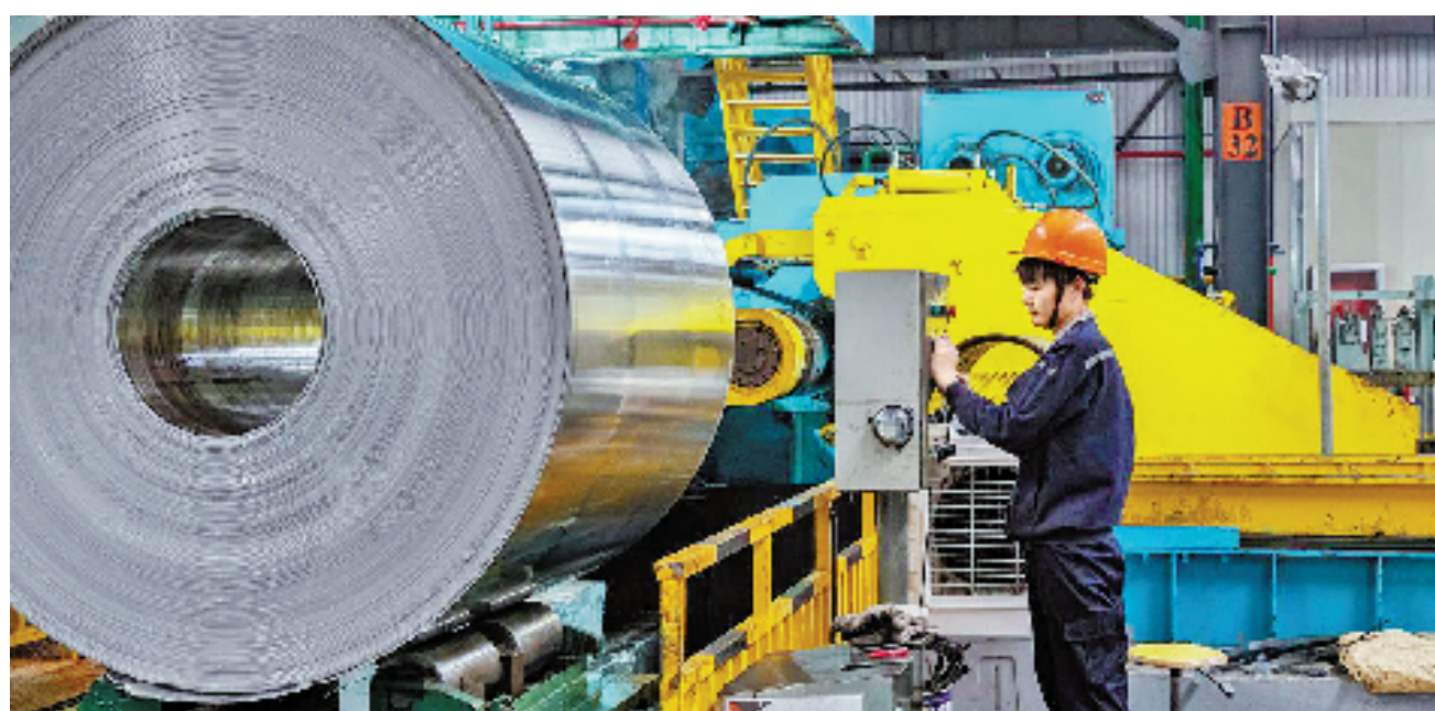
基地企业浙江铭岛铝业有限公司铝卷打包现场

企业也抢抓发展机遇,全力做好“专、精、特、新”的文章,持续推动“制造”向“智造”转变。