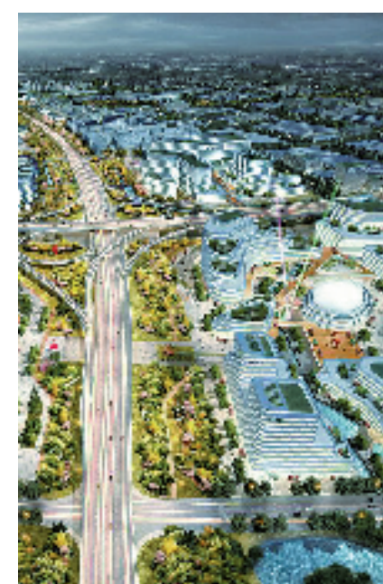
路桥经济开发区核心区城市设计效果图

企业也抢抓发展机遇,全力做好“专、精、特、新”的文章,持续推动“制造”向“智造”转变。