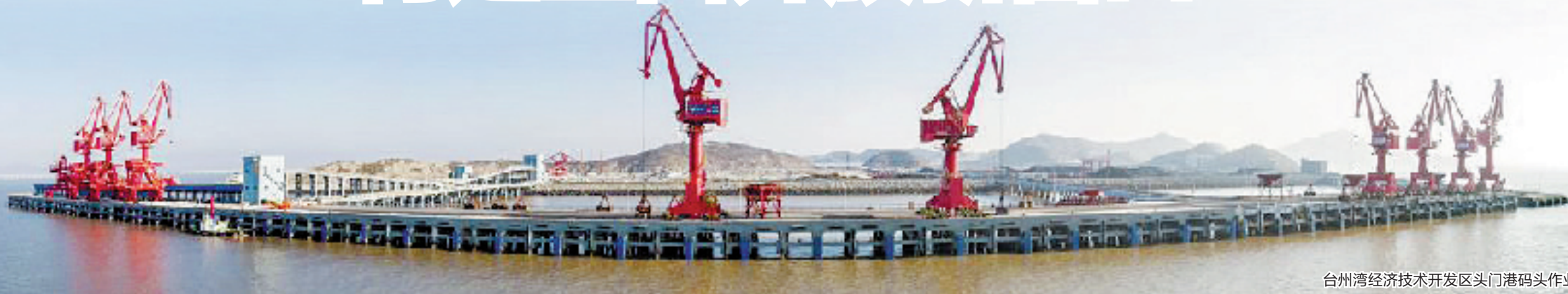
台州湾经济技术开发区头门港码头作业区

潮涌头门港,奋楫正当时。去年以来,台州湾经济技术开发区和台州综合保税区先后获批揭牌。两大国家级平台的加持,构筑起台州制胜未来的战略版图。