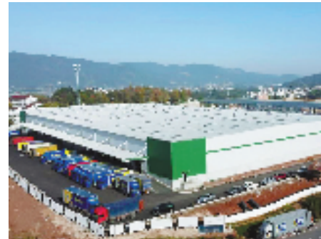
富阳经济技术开发区与缙云经济开发区结对后,引入富春集团,打造网营物联(缙云)智慧供应链产业园,固定资产投资额超10亿元。

发展布局,做强特色主导产业,提高产业支撑力,推动以产业链构筑人才链,以人才链提升产业链的良性循环。在山区县经济开发区开展12个产业链“链长制”试点,提升产业融合发展;创建“双链长制”试点6个,引导先进经济开发区及时共享本地溢出的产业信息,推动项目有效流转。