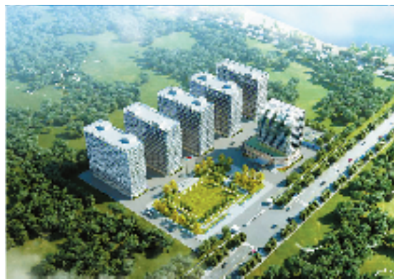
柯桥经济技术开发区与江山经济开发区共建结对,5月27日,“柯桥—江山飞地产业园”首个项目——宇越新材料年产60万吨光学级功能性膜材料制造项目正式开工建设。