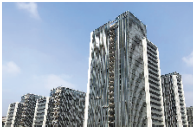
萧龙科创园位于萧山经济技术开发区桥南区块,是萧山经济技术开发区和龙泉经济开发区推动产业共建的重要载体和平台。