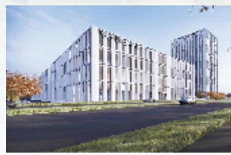
丽水经济技术开发区与宁波石化经济技术开发区开展产业链“双链长制”试点,协同两地资源优势,聚焦时尚产业和化工产业的绿色发展,聚力产业链共建。