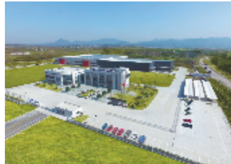
中德(缙云)产业合作园依托全球500强肖特玻管等项目,与德国工业4.0深度融合,打造利用外资“浙南样板”。