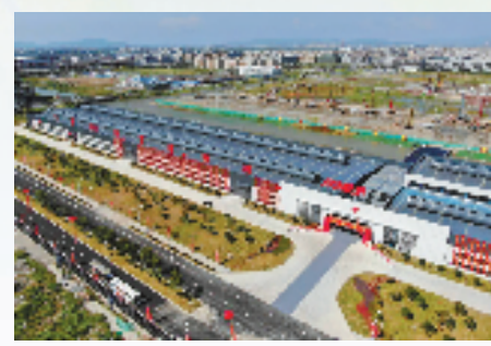
位于平阳经济开发区的平阳正成长三角电子信息产业中心,是温州首个投资超百亿元的制造业项目,涵盖金属和非金属新材料等产业,与当地汽摩配等传统特色产业形成互补。