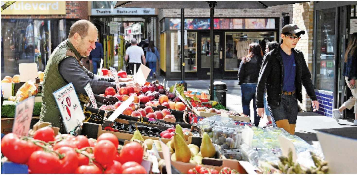
英国国家统计局前不久发布的数据显示,英国5月份消费者价格指数(CPI)同比上涨9.1%,继4月份后再创40年来新高。图为商販在英国伦敦整理摊位上的水果。

欧盟原计划在今年年底将天然气库存比例提升到90%,以应对未来的“气荒”,目前各国都在争相储气,平均储气量已经超过50%。俄罗斯选择在此时对天然气供应下手,立即让欧盟陷入被动,届时中小企业和受影响严重的家庭能否安然过冬面临不小压力。