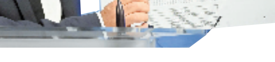
德国副总理兼经济和气候保护部长罗伯特·哈贝克日前在柏林的新闻发布会上展示采取不同政策后预计天然气储量图表。