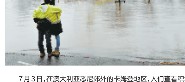
7月3日,在澳大利亚悉尼郊外的卡姆登地区,人们查看积水的公园。澳大利亚悉尼3日遭暴雨袭击,数千居民被迫从家中撤离,部分地区积水严重。