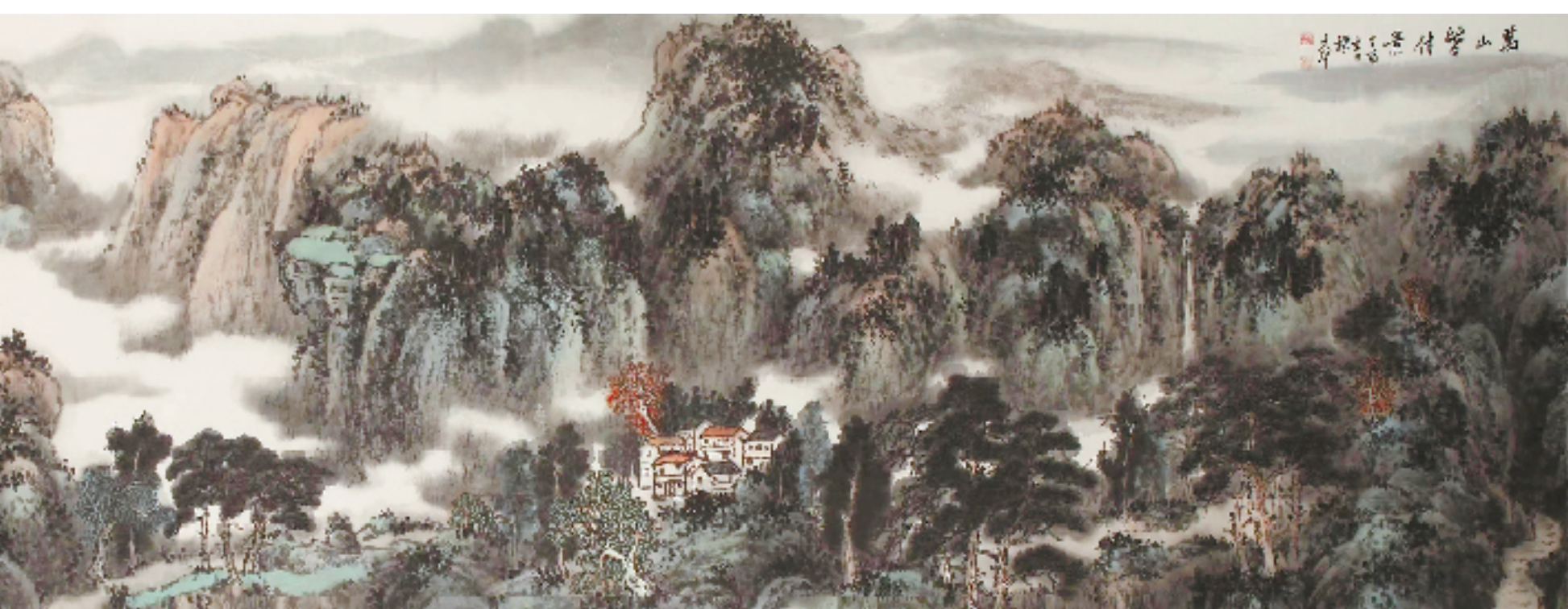
《万山皆佳景》(局部) 中国画 杨鸿圣 作