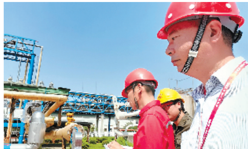
人保财险绍兴市分公司工作人员对危化品生产企业开展隐患排查