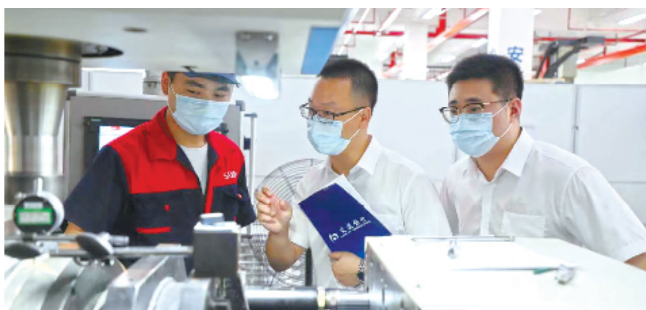
交通银行绍兴分行工作人员走访企业