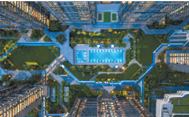
绿城·杭州晓风印月俯瞰实景图