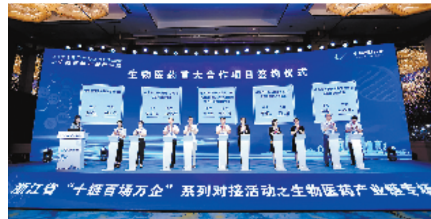
浙江省“十链百场万企”系列对接活动之生物医药产业链专场

数据最能说明进步的速度。2021年,全省生物医药产业实现总产值2512.5亿元,同比增长14.1%;出口总额725.9亿元,同比增长29.6%。新阶段、新征程给生物医药产业发展带来新使命。