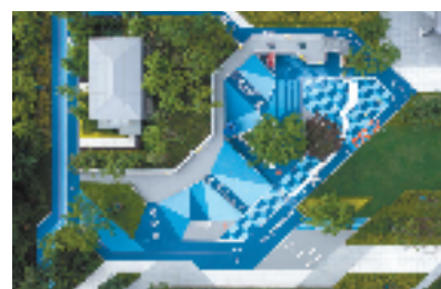
绿城·杭州晓风印月实景图——地景式儿童活动区

能。在晓风印月的儿童活动区,同步巧妙地增加了植物认知花园。五彩椒、五色梅、薄荷、棕竹、小五火……各种植物的标识牌上都有一个二维码,孩子们只要用手机扫一扫二维码,就可以获知这些植物的特性。