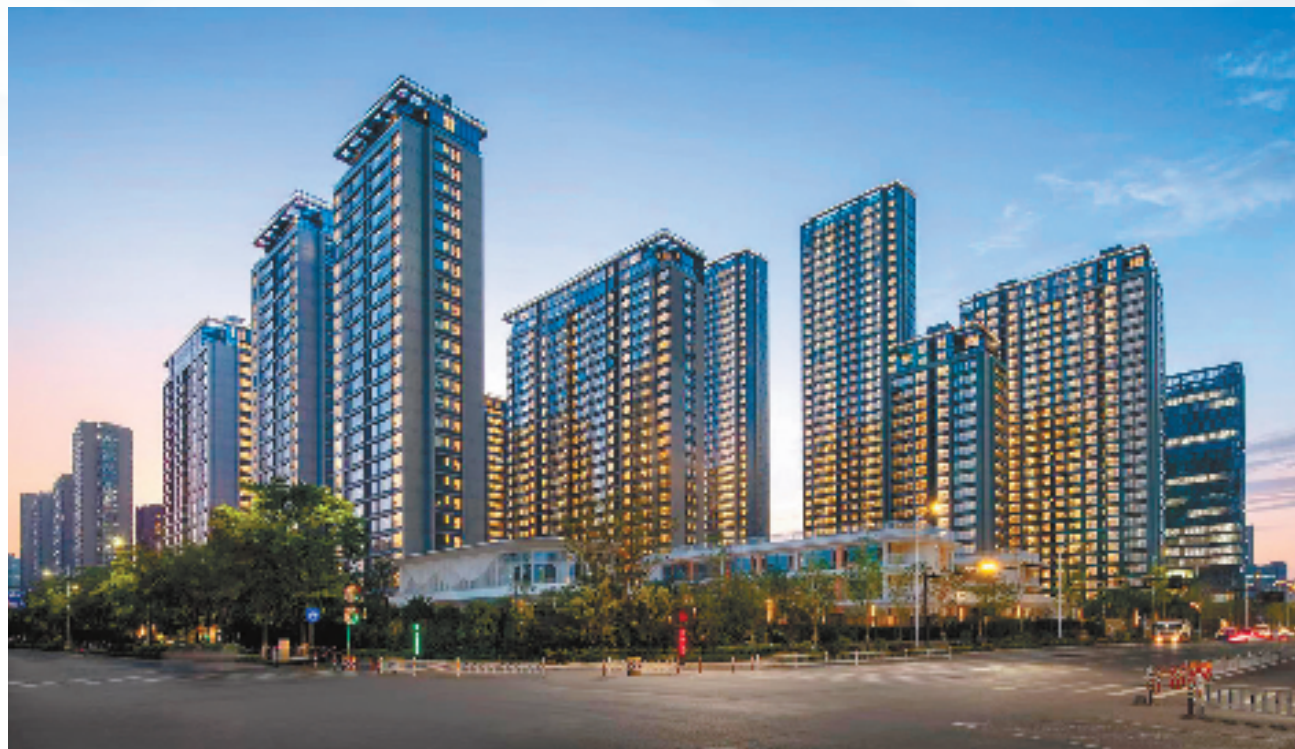
绿城·杭州晓风印月整体实景图