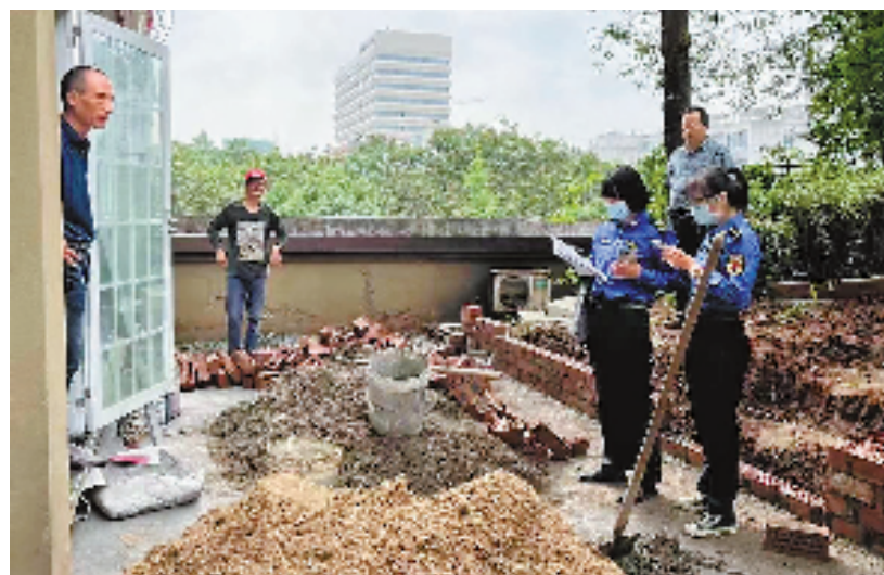
常山县金川街道综合执法队队员为违法行为现场拍摄取证,回传大数据后台。

变革重塑,将是未来5年浙江的重要工作方向。以数字化改革推动社会各领域体系重构、制度重塑、能力提升,形成引领未来的新模式新能力。浙江将继续从理论、实践和制度层面,探索共性、机制性的成果,为全国提供“浙江方案”。