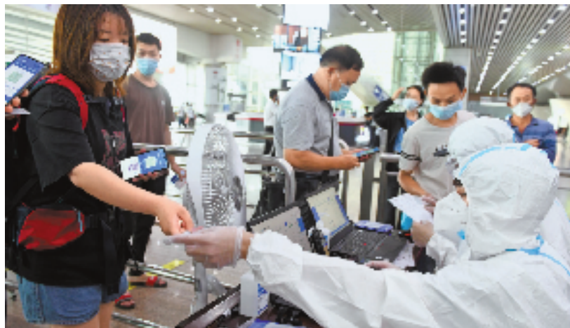
旅客在广州南站通过刷身份证识别健康码状态(资料图)。新华社发