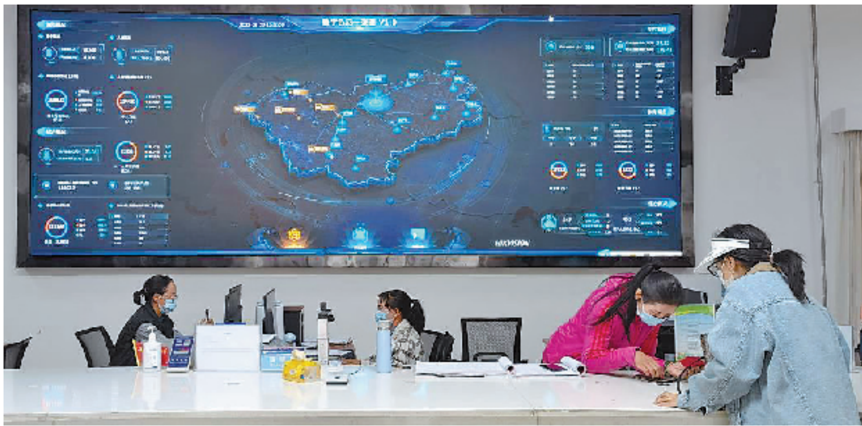
西藏那曲色尼区行政服务中心,“数字色尼一张图”相关数据在大屏实时显示,助力当地基层治理。

坚持问题导向,以重大需求牵引实现重大改革,这让浙江的数字化改革在大时代中有了大格局。浙江大学管理学院教授刘渊认为,纵深推进数字化改革要实现新突破,必须以精准识别需求为突破口,找准企业、群众、基层最为迫切的需求,最想解决的问题、最有获得感的领域。