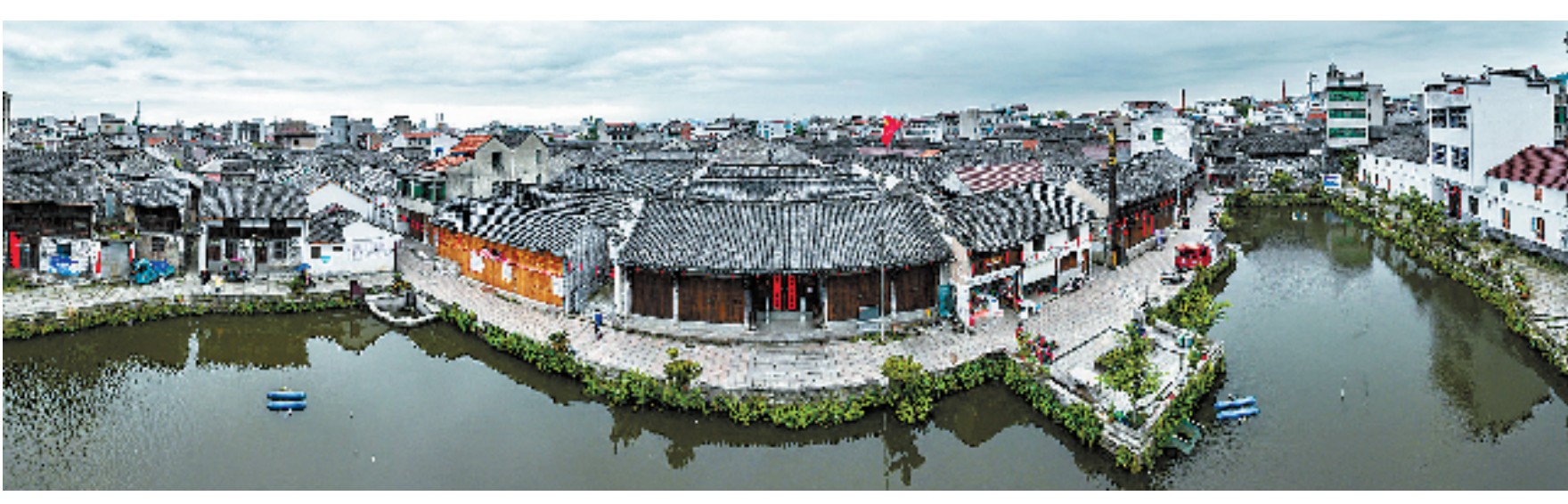
芝英古城方口塘区块