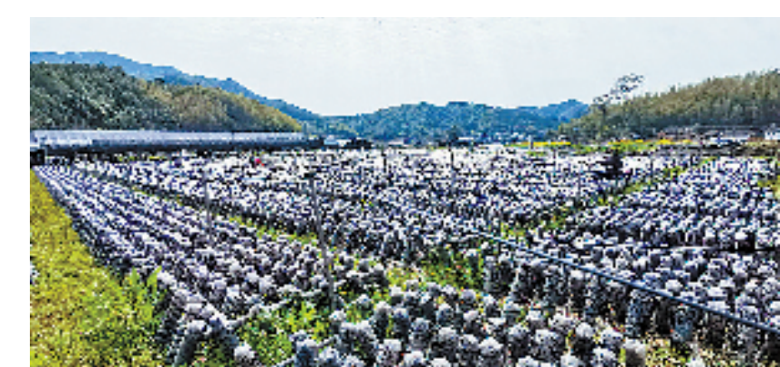
龙泉市八都镇双溪口村黑木耳人工培育基地。

“下一阶段，我们将依照省机场集团的最新决策部署，进一步加大帮扶力度，以高水平推进乡村振兴、高质量发展建设共同富裕示范区为引领，密切联系当地政府和干部群众，通过创新举措，狠抓落实，进一步改善村容村貌与村基础设施，打造美丽宜居的乡村环境，同时，多方位实施人文关怀，持续提升双溪口村干部群众的获得感、幸福感。”宁波机场有关负责人说。