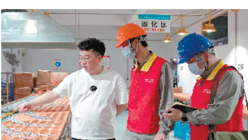
国网乐清市供电公司员工来到沪工集团了解企业夏季用电需求，协助企业排除用电安全隐患，分析用电需求变化，助力企业节能增效。

在走访中发现，电力市场化改革后，大部分企业存在电费计算计价的困惑。服务队现场向企业负责人发