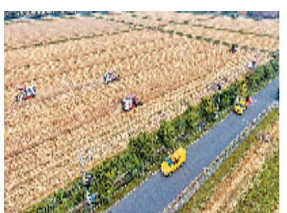
钱塘区供电公司服务秋犁农场

拉线等造成安全事故，确保农耕用电无忧。针对低压线杆存在不同程度树线矛盾以及配电设施老化等问题，队员也提出了有效解决方案，通过开展电力助农服务，给农业生产送上“放心电”。