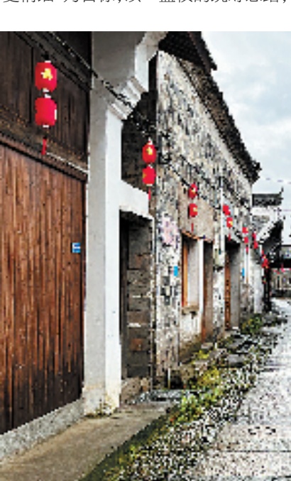
芝英古城正街(古麓街)

循着栀子花香，徜徉在千年历史古镇永康市芝英镇，那浓郁的乡愁就深藏在一座座祠堂之中，白墙黑瓦、亭台楼阁、青石小道，是悠久岁月的咏叹调。