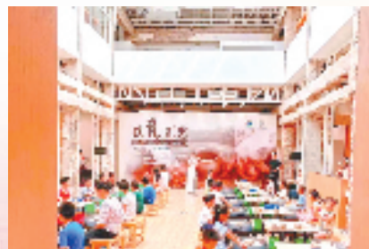
瓷源文化小镇研学基地

未来,上浦将立足深厚的文化积淀,依托党建引领,数字化赋能,不断打造乡村振兴先行村,展现具有地域特色的乡村振兴模式和致富成果。