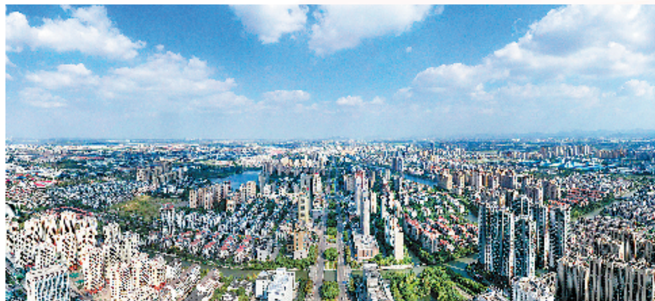
斗门街道中心商务区

一个是2500多平方米的斗门街道“红立方”党群服务中心。里面不仅有越城区最大的图书馆,还有文化站以及新时代文明实践所等一系列设施。建成