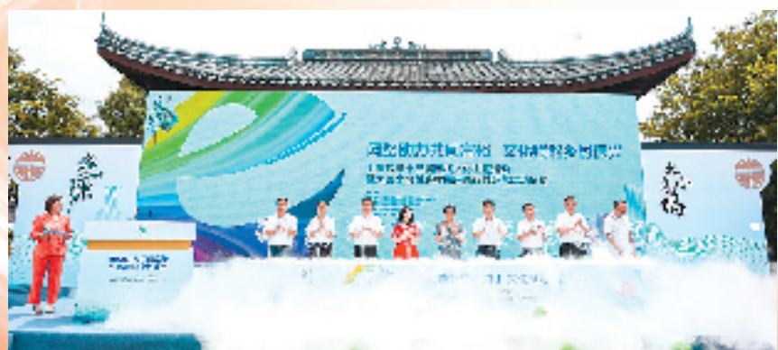
大善小坞村乡村振兴先行村运营启动仪式