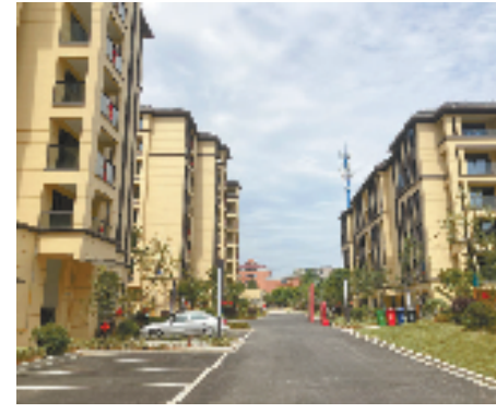
越兴家园保障房项目

牌头镇把努力让全体人民住有所居作为重要衡量标准,深入贯彻落实《意见》要求,加大保障房建设投入力度,探索农村宅基地“三权分置”实施办法,建立健全科学的农村住房保障体系,优化规划选址,释放闲置土地资源,建设小区式、集聚式农村保障房,既缓解了农村住房困难问题,改善了农村生活环境,又促进了土地节约集约利用,描绘出城乡融合发展新画卷。