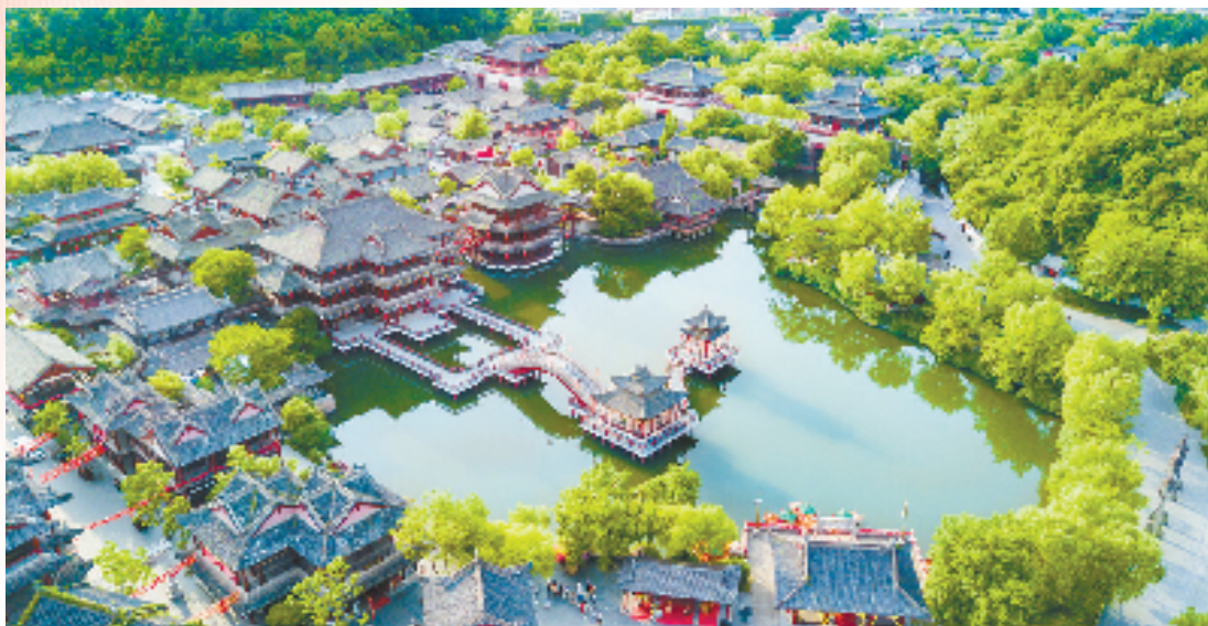
横店影视城清明上河图景区

未来，东阳将全面加强党的领导，强化工作统筹，通过“三级书记抓共富、专家团队谋共富、科学机制助共富”等，创新完善推进共同富裕的体制机制，形成体系化推进格局，确保共富工作纲举目张、蹄疾步稳、先行示范。