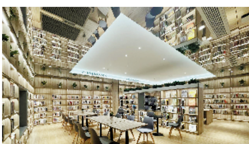
德清县禹越镇的禹悦书房内景。