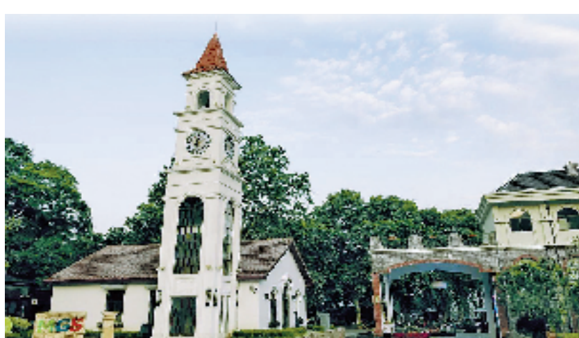
德清县莫干山镇燎原村农家书屋外景。