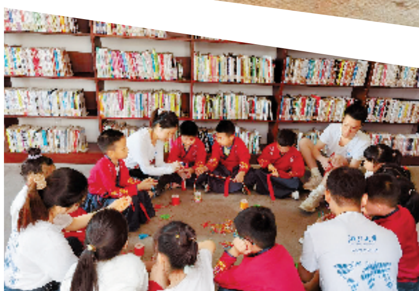
燎原村农家书屋结合莫干山镇打造的作家村、编剧村和艺术村不定期举办分享会。