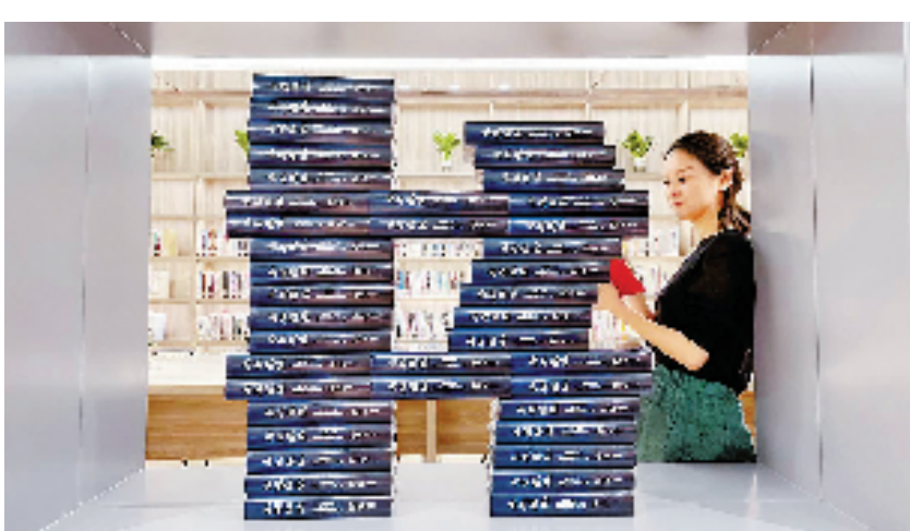
村民在农家书屋静享阅读。