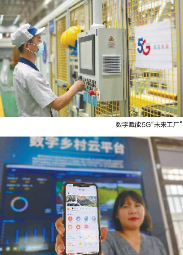
数字赋能5G“未来工厂”

在以云网融合赋能数字化应用方面，将发挥云网融合优势，加快推进5G、云计算、人工智能、大数据等为代表的新一代信息通信技术与数字政府、数字经济、数字社会、数字文化深度融合，助力经济社会高质量发展等。在以自主可控筑牢数字安全屏障方面，浙江电信正在湖州、绍兴等地筹建大数据数据安全运营中心，不断夯实数字化改革安全底座等。在以科技创新健全自研能力体系方面，将打造科技型企为已任，全力支持我省数字化改革与高质量发展建设共同富裕示范区。