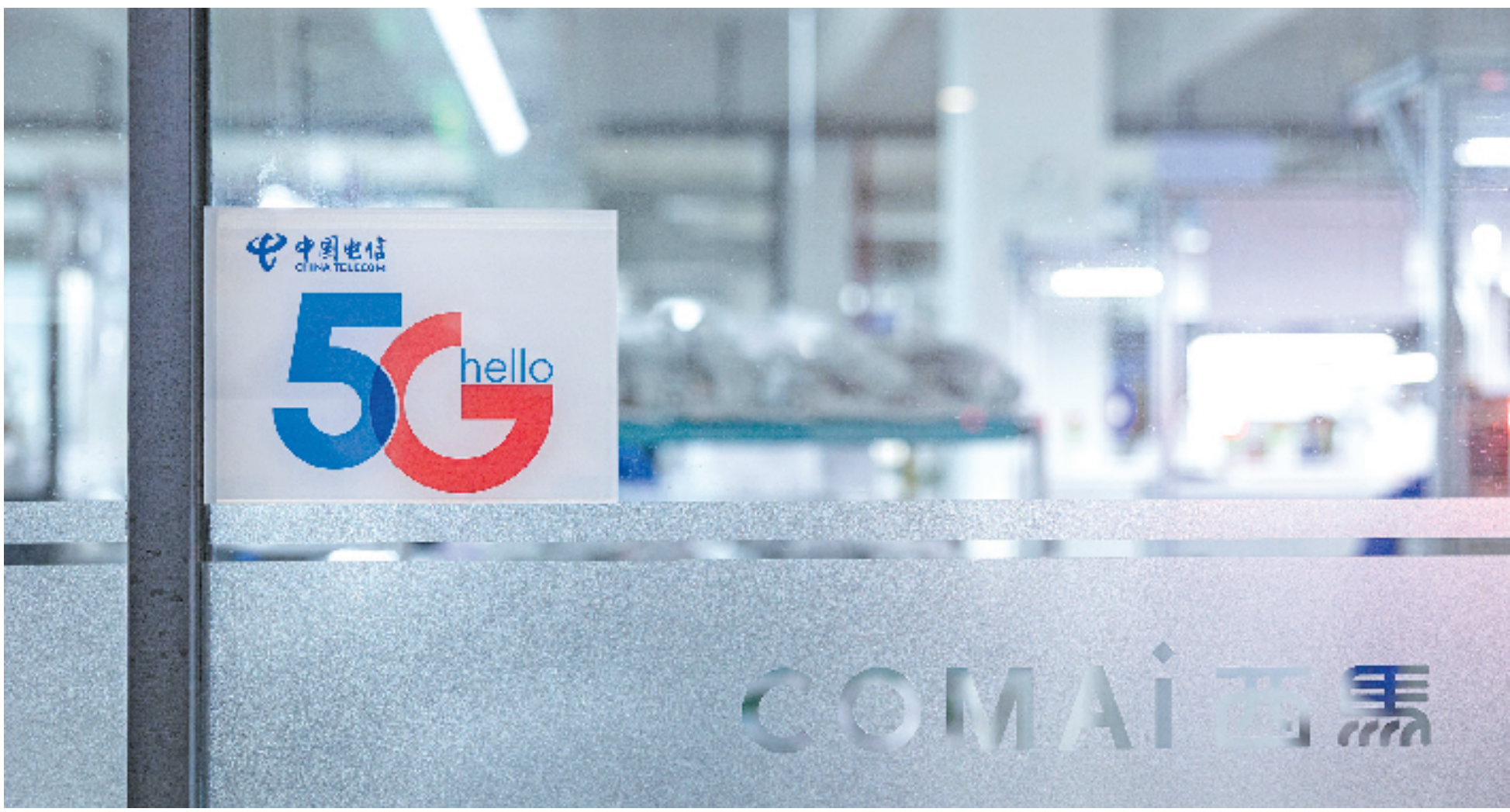
电信5G赋能千行百业