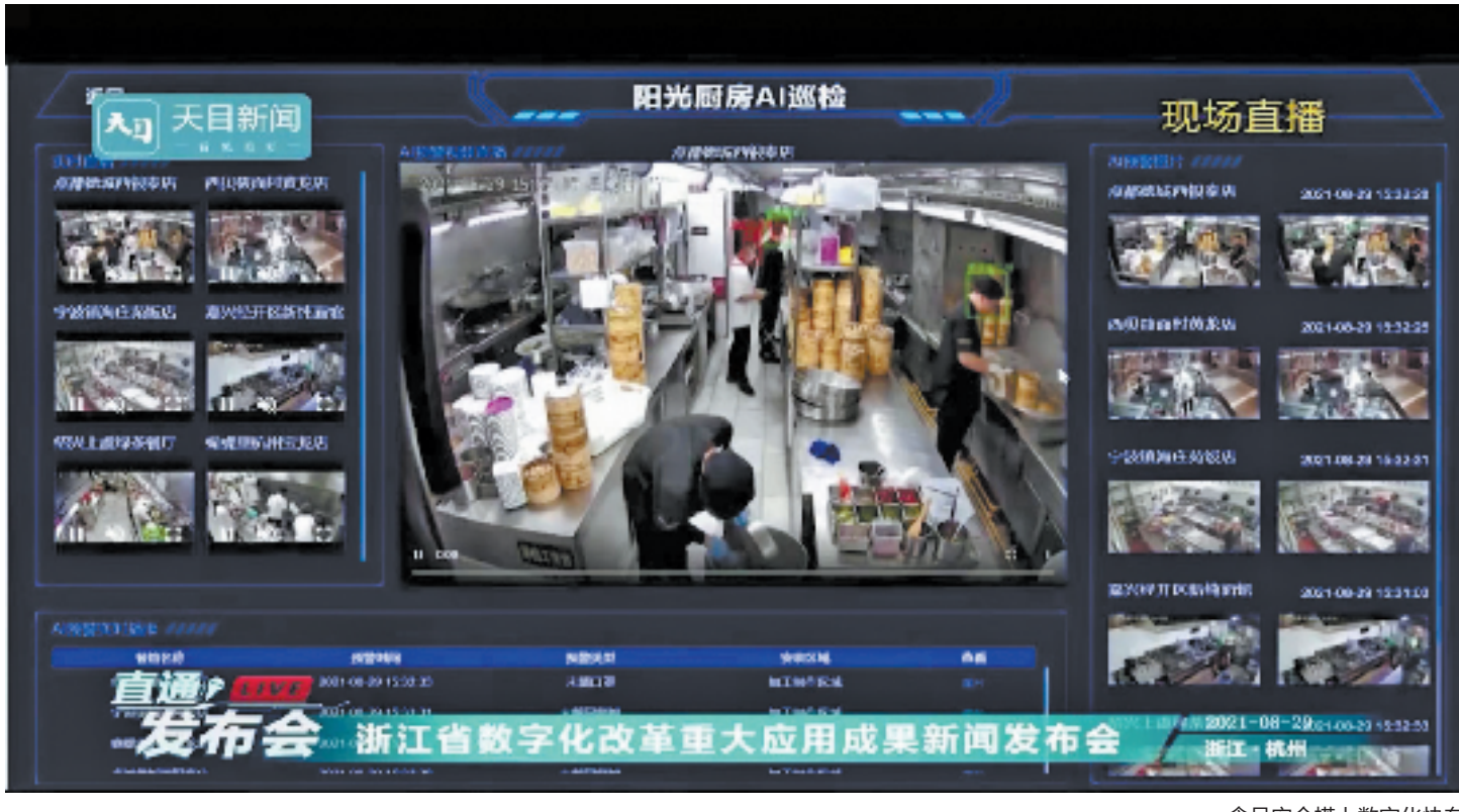
食品安全搭上数字化快车