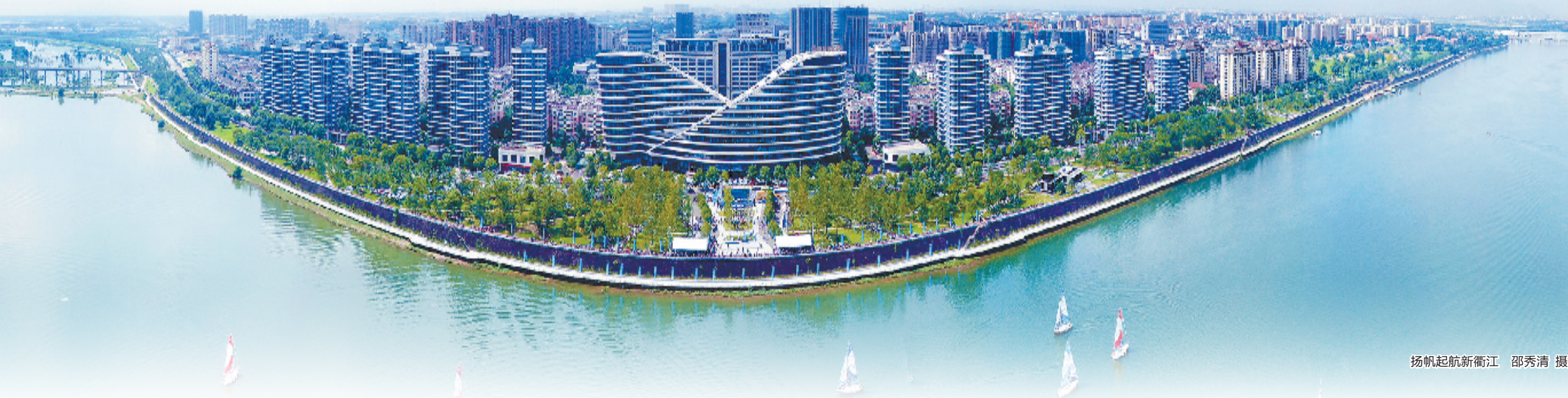
扬帆起航衢江

追赶跨越，衢江加快前行——聚力枢纽之城、康养之城、活力之城、幸福之城、智治之城“五城”建设，实施空港新城筑基工程、工业经济提升工程、全域旅游提升工程、城市能级提升工程、乡村振兴提升工程、幸福生活提升工程、整体智治提升工程，紧扣打造四省边际中心城市、建设四省边际共同富裕示范区这条主线，聚焦六大关键，实现六个突破，作出衢江贡献、展现衢江担当。