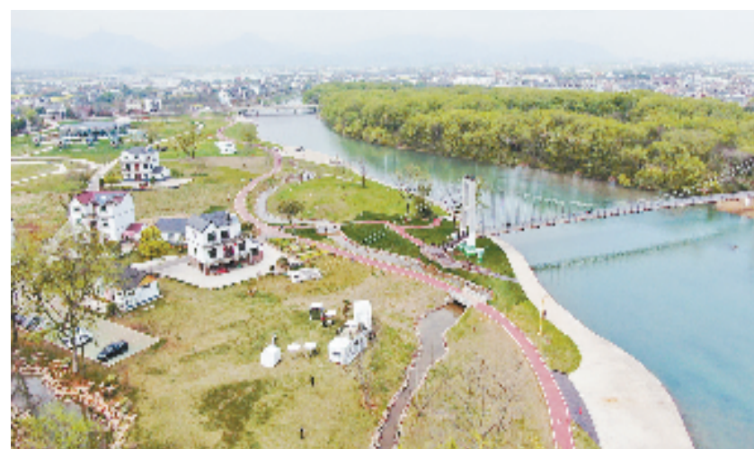
莲花未来乡村

诗画风光带山水间，尺方间文化创意园、六春湖高山滑雪旅游度假区、新田铺田园康养综合体等总投资超400亿元的十大文旅标志性项目串珠成链……康养禀赋吸引总投资60亿元的梦回唐朝国风溯唐项目落户，不久