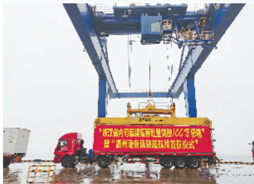
衢江港区

四省边际枢纽港列入义甬舟开放大通道西延行动15个重大标志性项目、省“十四五”规划纲要、省现代物流业发展“十四五”规划；浙江自贸试验区衢州联动创新区获得授牌，商贸物流产业获省“一县一策”精准扶持，第四批国