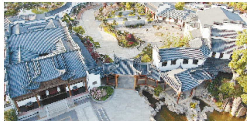
尺方间文化创意园

长，长三角商业新零售创业创新中心落地建设，企业数字化赋能中心建成投运，衢江成为全省首批进口贸易促进创新示范区、商务领域共同富裕试点，第三产业增加值、规上服务业营收增幅领跑衢州。正在谋划的国家纸浆储备库将补齐进口纸浆物流短板，陆港现代物流中心将发展智能仓储和智慧物流……战略性、引领性项目不断改写衢江的时空格局，新经济、新引擎提速产业转型升级。