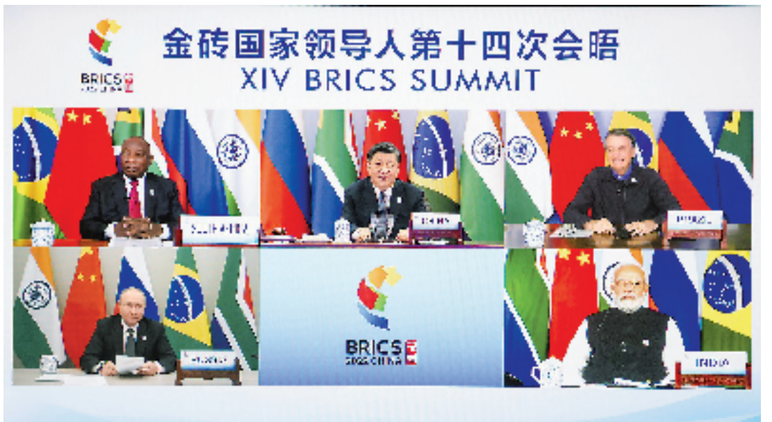
6月23日晚，国家主席习近平在北京以视频方式主持金砖国家领导人第十四次会晤并发表题为《构建高质量伙伴关系 开启金砖合作新征程》的重要讲话。南非总统拉马福萨、巴西总统博索纳罗、俄罗斯总统普京、印度总理莫迪出席。