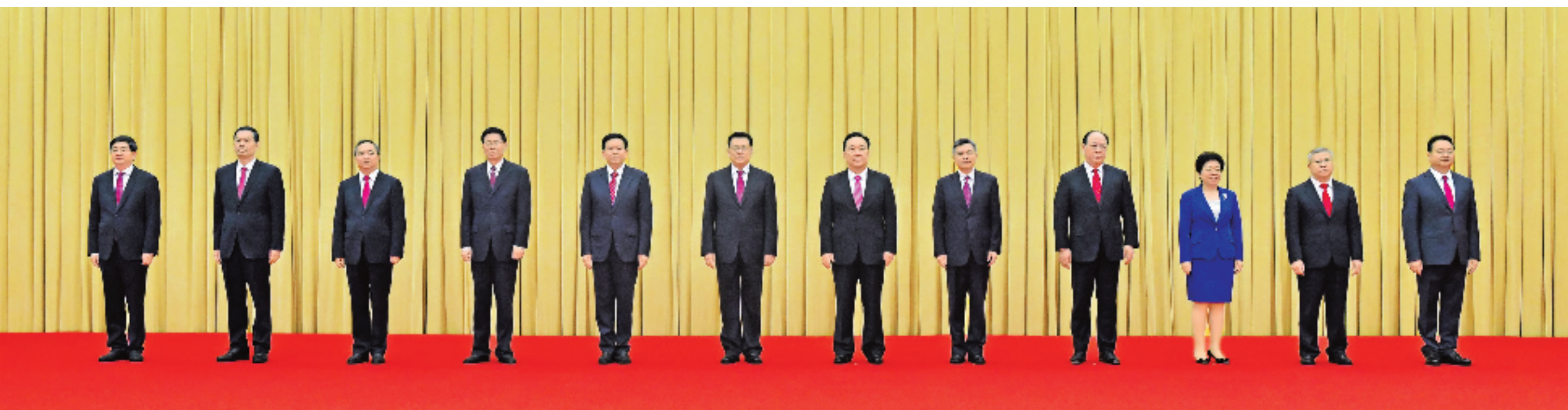
6月23日上午，中共浙江省委十五届一次全会结束后，新当选的省委书记袁家军，省委副书记王浩、黄建发和省委常委刘捷、许罗德、彭佳学、王成、陈奕君、刘小涛、徐文光、邱启文、王钢，在省人民大会堂与媒体记者见面。