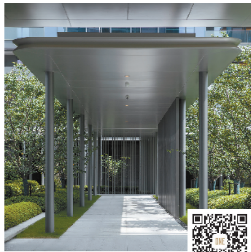
杭州信达中心|臻奥院风雨连廊实景图