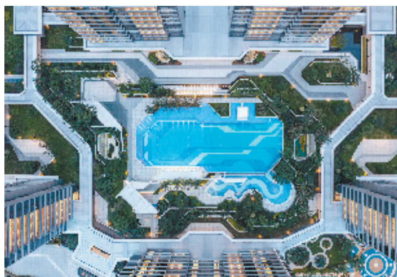
杭州信达中心|臻奥院室外泳池实景图

只有全城一流的住宅，才能承载这些人才的需求。不难想象，高级人才的长期定居，必将带来更多研究资源的落地，让更多人才和产业奔涌而来，为城市高质量发展创造不竭的动能。