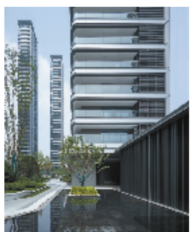
杭州信达中心|臻奥院园区实景图