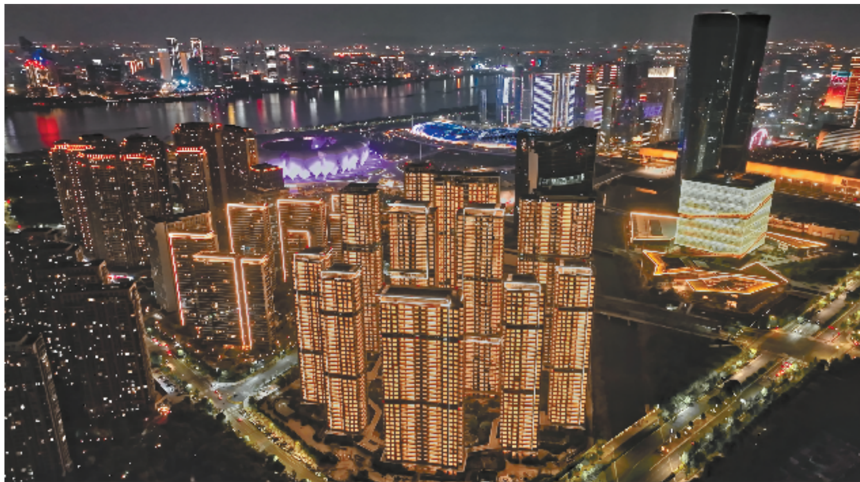
杭州信达中心|臻奥院实景鸟瞰图