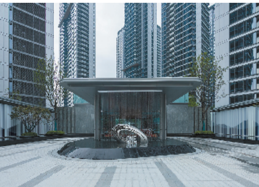
杭州信达中心|臻奥院主入口实景图

不远处，钱塘江水奔流不息，奥体中心主体育馆宛若一朵莲花魅力绽放，“玉琮”、“化蝶”、“小莲花”、国际博览中心、城市之门等城市地标群映映在一片绿色之中。位于滨江区奔竞大道与彩虹路交汇处、奥体中央公园内的杭州信达中心，自然而然地融入其中，一同构筑起“世界的杭州”的封面盛景。