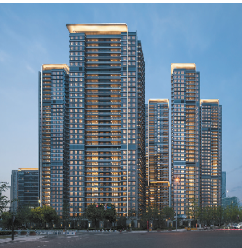
杭州信达中心|臻奥院建筑实景图

央企信达地产汇聚众力，与融创中国、滨江集团组成一支“梦之队”，携手共建这个“城市共同体”，书写动力澎湃的城市华章。