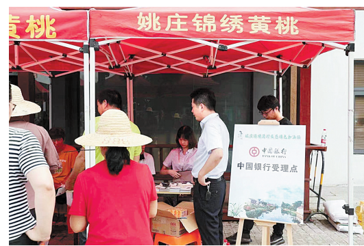
嘉善县姚庄镇居民进行绿色生态积分集中兑换

“我用积分兑换些生活日用品。”“家里牙膏、纸巾正好用完了，我来换一些。”在嘉善县姚庄镇横港村，“生态绿色加油站”一进村，就受到了村民的一致好评。攒积分、换积分一时成了新风尚。去年，“生态绿色加油站”还迎来了一场大升级，分行在此前的基础上，针对农村创业者推出“美丽乡村贷”，“三治积分”除了兑换生活必需品，还可申请“美丽乡村贷”