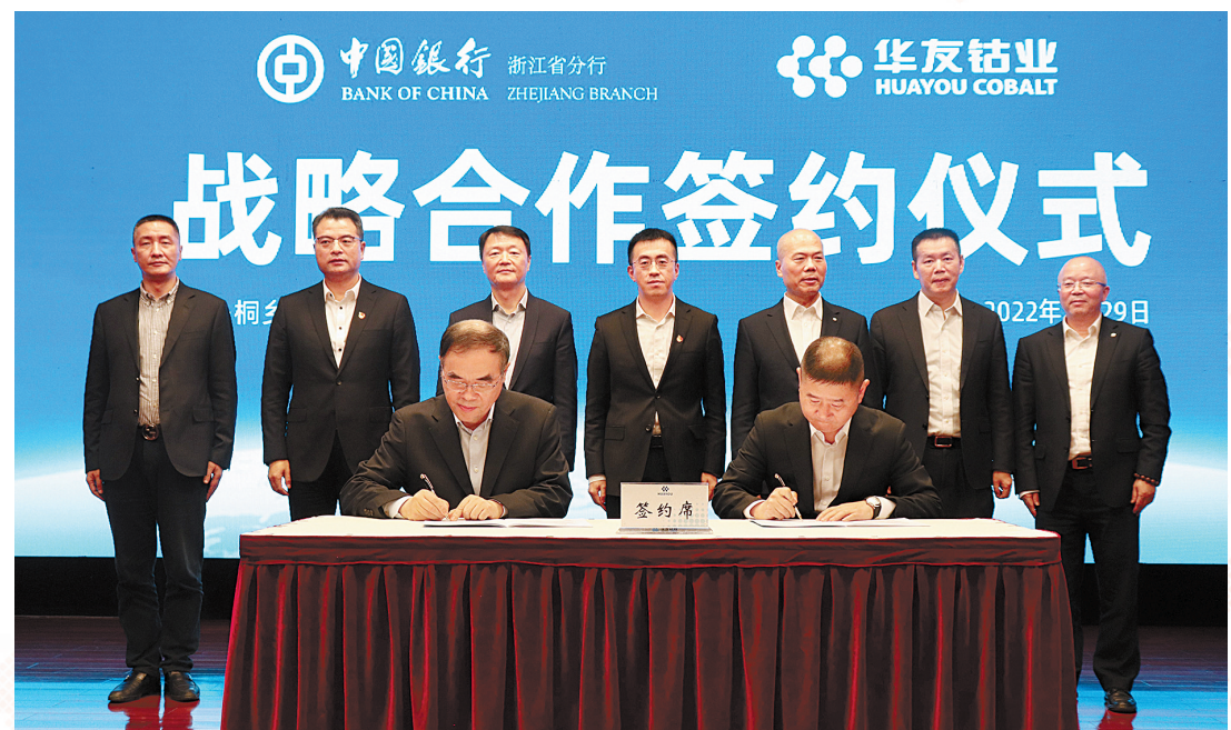
中国银行浙江省分行与华友钴业举行战略合作签约仪式