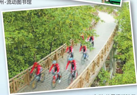
台州·仙居绿道骑行