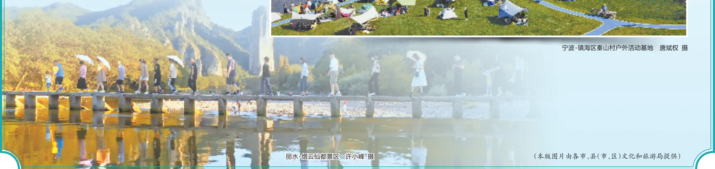
丽水·缙云仙都景区