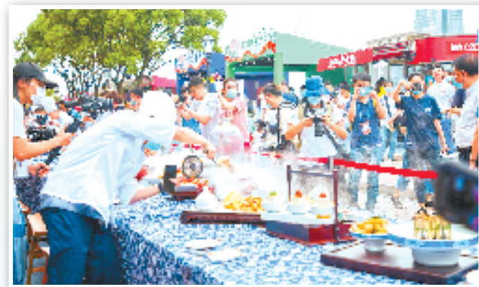
金华·百县千碗金华有味美食大赛