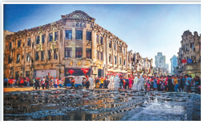
温州·五马街的街头艺术表演