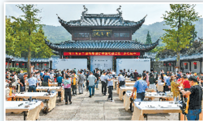
绍兴·嵊州市第19届国际书节