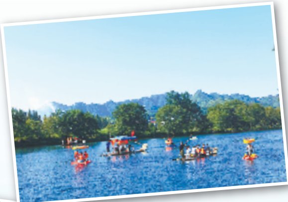
衢州·开化县音坑乡下淤村