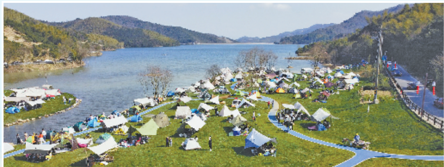
宁波·镇海区泰山村户外活动基地