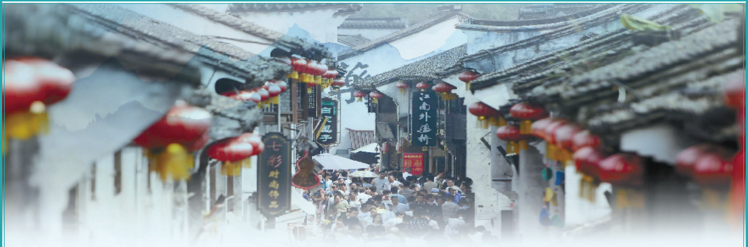
嘉兴·月河历史文化街区