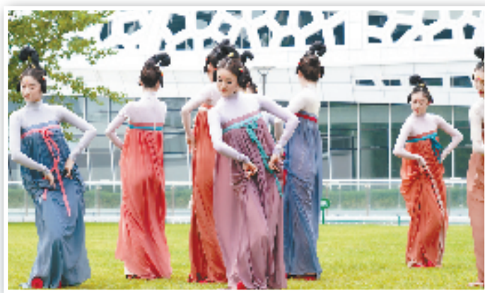
杭州·运河大剧院快闪活动