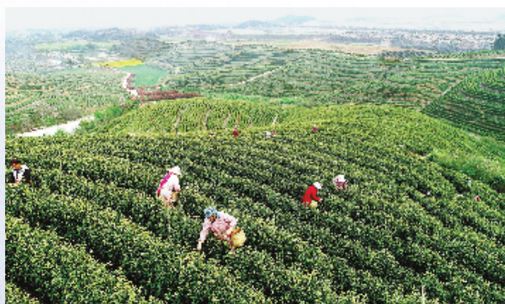
2020年4月3日,湖州市吴兴区埭溪镇东红村婆棚山,采茶工人们正在采摘清明前的白茶“黄金叶”和“黄金芽”。茶场原先是废弃石矿,通过生态治理和复垦后变成了千亩茶园。