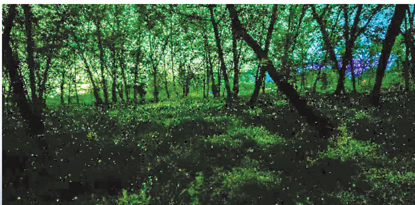
2022年3月29日晚,在丽水九龙国家湿地公园,大片的萤火虫在灌木丛中忽闪,让树林看起来如梦似幻。丽水拥有良好的生态和丰富的动植物资源,加之近几年湿地公园的生态修复和保护,当地成了萤火虫重要的栖息地。