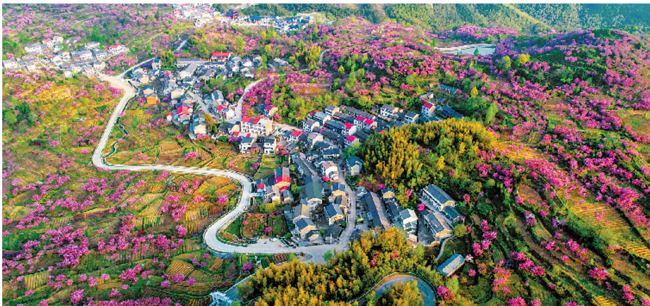
2018年9月,浙江“千村示范、万村整治”工程,被联合国环境规划署授予最高环保荣誉——2018年“地球卫士奖”。联合国称,这是“极度成功的生态恢复项目”。图为余姚市大岚镇上马村,春天樱花开满山头。

烟雨西湖屡屡喜提热搜,复绿矿山催生美丽经济,丽水全城行动保卫萤火虫……“浙”里的山水间,总有精彩的故事在发生。绿色,真真切切成为浙江发展最动人的色彩。绿水青山,也成为浙江人的幸福“靠山”。