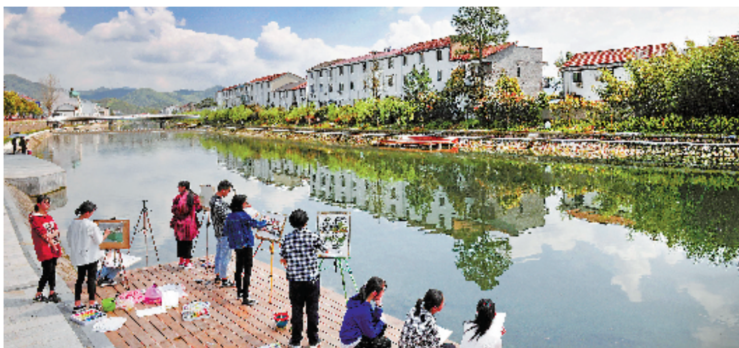
2018年3月,诸暨市湮浦镇溪水清澈见底,引来不少前来写生的青年人。《浙江省生态环境状况公报2021》数据显示:全省生态环境公众满意度为85.81,实现连续10年上升。