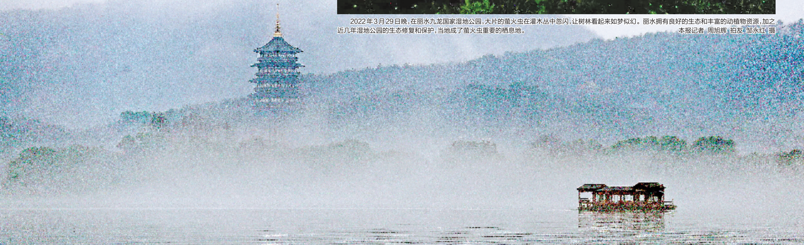
2020年2月14日,浓雾漂浮在西湖上,湖边城市、群山在雾中若隐若现,如梦似幻。近年来,“烟雨西湖”屡屡喜提热搜,成为杭州一道独特的风景。