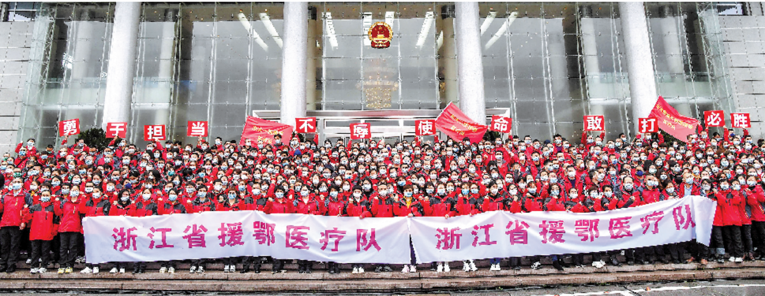
2020年2月14日,浙江省第四批援助武汉医疗队共453名医疗业务骨干从杭州启程,赴武汉参与新冠肺炎患者的医疗救治工作。