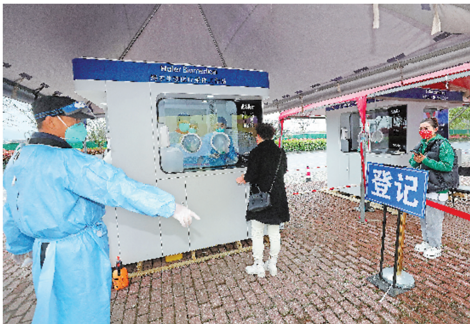
2022年4月5日,杭州市西湖区双浦镇高速公路临时核酸采样点,防疫人员在核酸采集舱里为货运司机和相关工作人员进行核酸检测。