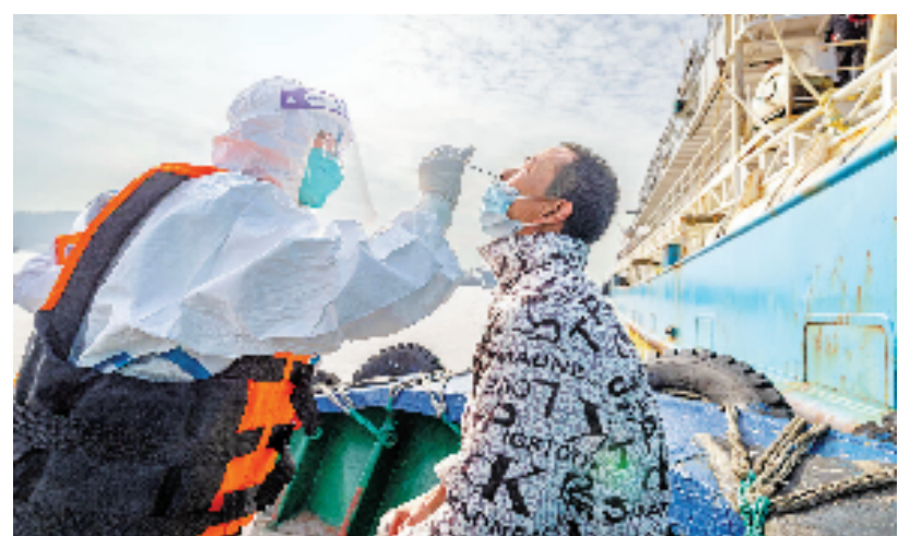
2021年12月22日上午,温岭市石塘镇卫生院海上防疫采样队的工作人员正在为一艘远洋归港渔船上的渔民进行核酸样本采集。

浙江儿女在大考面前凝巨力,携手铸就了抗击疫情的英雄群像,同心谱写了浙江精神的恢宏乐章。