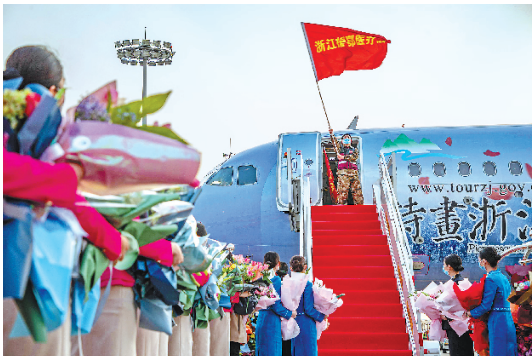
2020年3月19日下午,浙江援鄂医疗队首批返浙队员回到杭州。