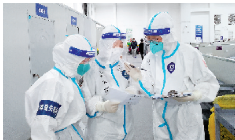
援沪期间,浙江省援沪方舱医疗队四队进入上海临港方舱医院收治患者。