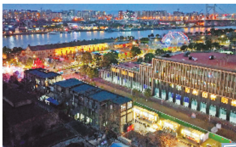
后 “拾里江丰”项目夜景