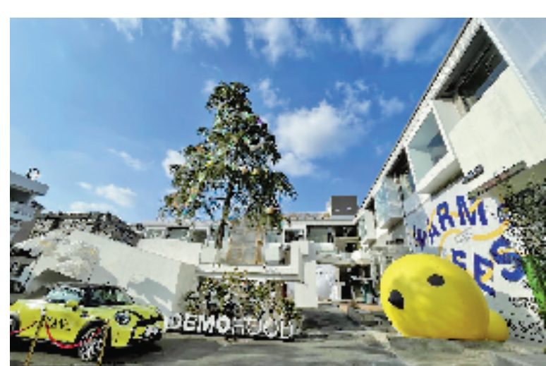
由白天鹅毛巾厂改造成的“带梦胡同”,成为宁波新晋网红打卡地。