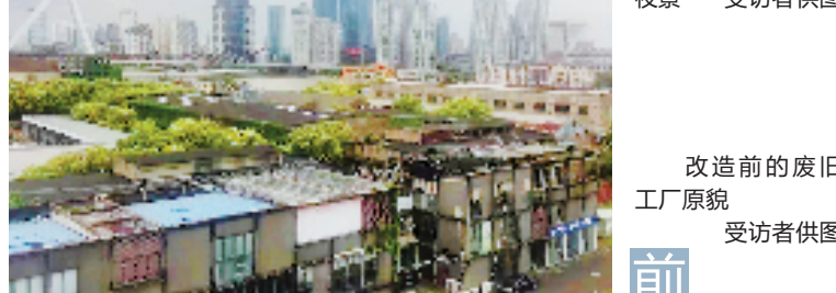
前 改造前的废旧工厂原貌