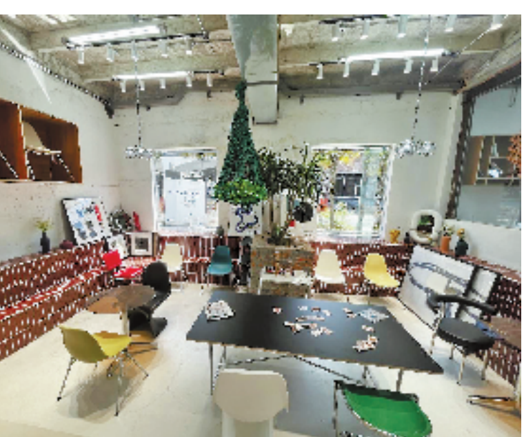
由杭钢薄板厂澡堂改成的艺术工作室

更引人关注的,是后冬奥时代首钢园区的运用。改造之初,规划设计团队就考虑到建筑退台、地下通道、地表路径、空中连廊的贯通,既能对接城市道路,又能链接轨道交通,让更多居民能清洁、便捷地到达。这样一来,园区变为公共空间,回归休憩、文化等功能。未来,通过产业不断迭代,园区能与城市同呼吸、共成长,也将带动整片区域的蝶变和复兴。