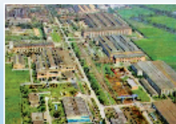
前 杭州重型机械厂老厂房(20世纪80年代)

进入高质量发展的时代,城镇建设总体由“大规模增量开发”转向“存量提质改造”新阶段。散落城市的工业遗存,能否延续生命、拥有全新功能?近日,记者前往杭州、宁波等地,透过粗犷的建筑外表,尝试读懂其中耐人寻味的精神气质,以及城市、社区的新气象。