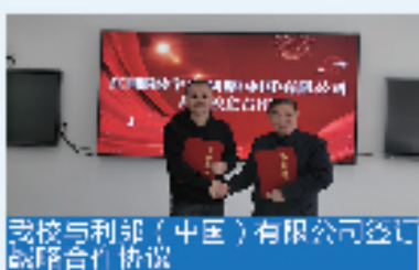
我校与利郎(中国)有限公司签订战略合作协议