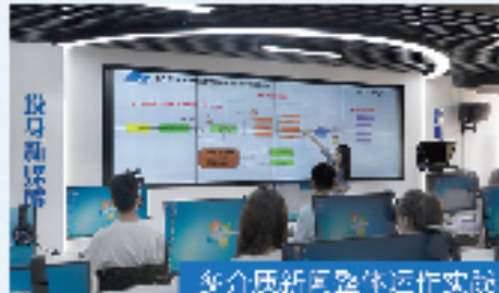
多介质新闻整体运行实训