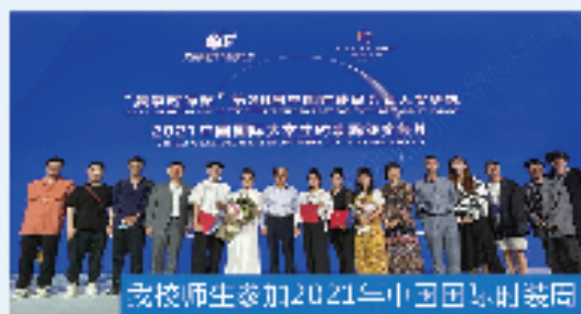
我校师生参加2021年中国时装周