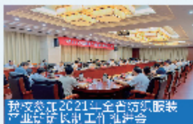
我校参加2021年全省纺织服装产业研究促进会