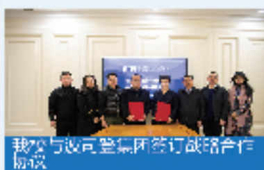
我校与设计集团签订战略合作协议