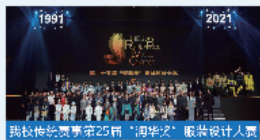
我校传统赛事第25届“润华奖”服装设计大赛