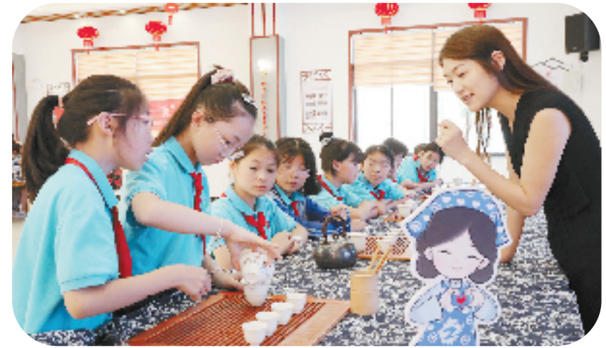
德清县新安镇西庙桥村幸福邻里中心开展公益活动

“周末我们会不定期邀请志愿者老师开展公益活动，暑期则会推出‘春泥计划’活动，教小孩子认字、绘