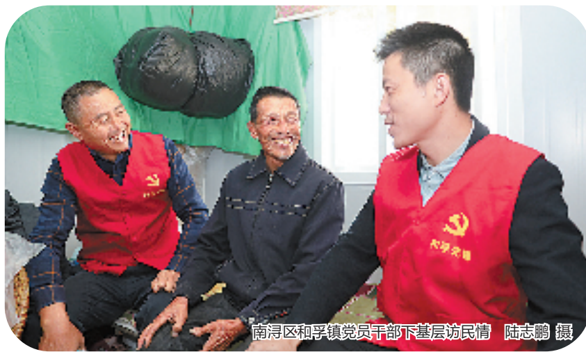
南浔区和孚镇党员干部下基层访民情

缺什么补什么，突出问题导向、实战导向，在提高培养年轻干部服务群众、文字综合、廉洁自律等方面的同时，不忘加强“心理辅导”，解答年轻干部思想上的困惑，动态掌握他们的思想状况和业务水平，确保各项工作有序推进。