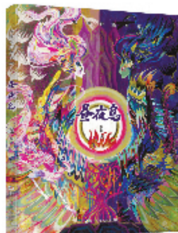
浙 《昼夜鸟》 封面