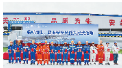
2017年12月27日临时用电、起重技能安全大比武

“瓯江红、北口梦”党建品牌诞生于风险高、任务重、技术难、工期紧的国家级重大桥梁工程上,探索形成一条党建工作与工程建设业务深度融合的有效路径,发挥出党组织的政治优势、组织优势、群众优势,协调好各方资源,谋实事、出实招、求实效,是一种针对性强、共建共享、深度融合的党建思维与管理模式。未来几年,国家建设交通强国、浙江建设高水平交通强省的任务仍非常繁重,北口大桥“党建+重大工程”管理方案实现党员带群众共建精品工程,具有较大的积极意义。