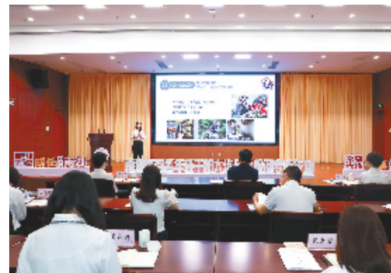
新任科级年轻干部代表进行百日履职大考评

7名来自南湖新区直机关、镇街道的新任科级年轻干部依次上台展示,围绕换届任职以来的工作感悟,谈履职体会、比思路举措、拼工作成效,亮晒履职百日成绩单。由来自新任科级年轻干部原单位、现单位分管领导和区领导、部门代表、优秀年轻干部代表组成的百人口碑评审团,现场对7名年轻干部进行测评打分。2名履职成效明显、现场表现优秀的新任科级年轻干部现场获颁青春榜样奖。