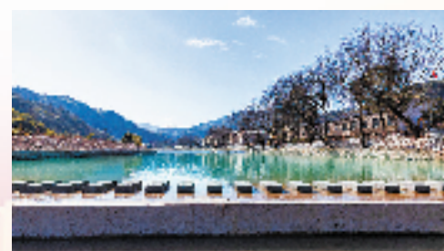
谷来镇小舜江马溪段

此外,谷来镇还把“清廉村居”与“美丽城镇”工作深度融合,打造“一镇一品、一村一品”。强化小微权力监管不松劲,牢牢抓住农村集体“三资”管理关键环节,深化村级权力信息公开建设,开设“小微权力监督一点通”小程序,推动健全“基层公权力平台2.0全程在线审批子应用”常态化、规范化运行,坚决整治不正之风和腐败问题,推动村干部廉洁办事、高效办事。