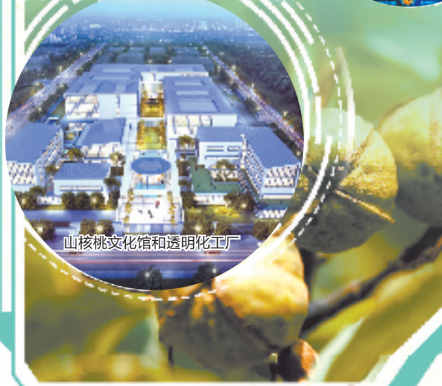
山核桃文化馆和透明化工厂