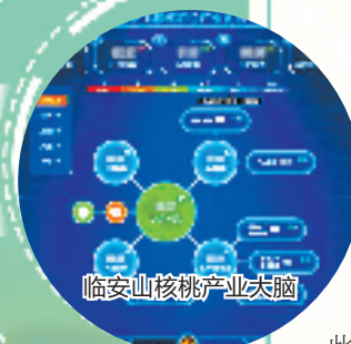
临安山核桃产业大脑