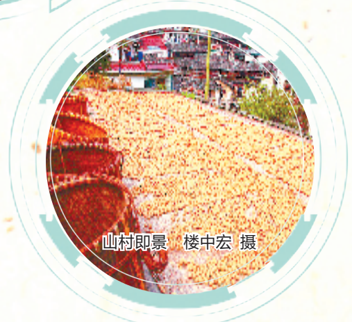
山村即景