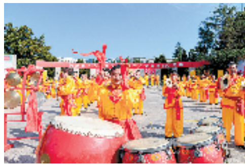
国家级非遗——长乐吹打

良好的环境,加快了长乐镇城乡融合建设的步伐。该镇以铁路站建设为核心,过前期城镇发展边界调整为契机,优化产业发展、商贸服务、医疗卫生等基础配套设施,启动了铁路站站前区块发展规划编制。同时,以“宜居”为目标,推进美树商贸综合体、嵊西商贸楼、美丽城镇建设等项目,提高服务业现代化水平,为嵊州打造高质量发展建设共同富裕示范区县域样板贡献更多长乐力量。