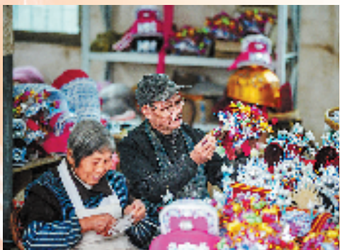
黄泽戏剧服装制作