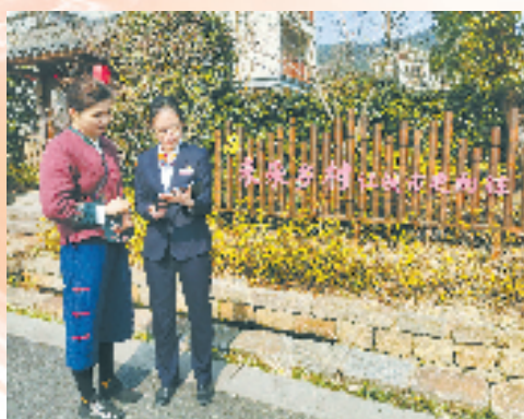
余杭农商银行立足当地资源优势，大力支持农旅产业发展。

辖内杭州联合银行第一时间与始版桥社区、采荷荷花塘社区等5家全省首批未来社区试点创建项目签订战略合作协议，向始版桥未来社区建设单位授信16亿元，深入参与前期的拆迁安置、过渡费发放全过程，简化业务流程、上门服务，高效便捷为社区居民提供各项配套服务。