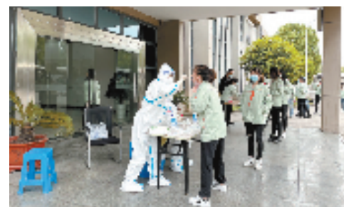
核酸检测送到厂门口

工业与农业协同，颜值与内涵并重，充满激情和活力的平湖经开，正以高质量发展的姿态，奋力谱写共同富裕新画卷。