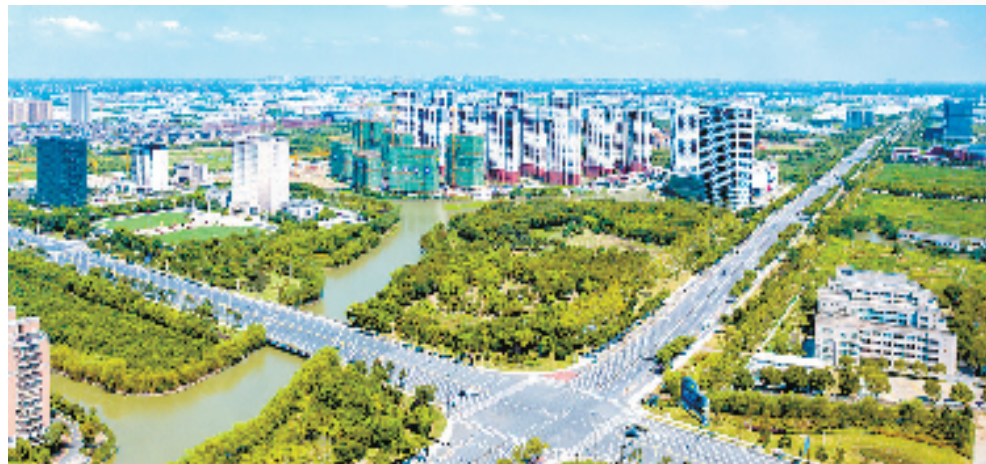
平湖经济技术开发区

当浙江吹响新一轮制造业“腾笼换鸟 凤凰涅槃”的号角，平湖经开运筹帷幄，将其视为“加快产业转型升级，助力城市有机更新”的有力抓手，出台了《平湖经开腾笼换鸟整治提升实施方案》主方案和《企业大整治行动方案》两个子方案，按照“改造提升一批、整治规范一批、关停淘汰一批、腾退回收一批、兼并重组一批”的原则，对低效企业进行改造提升，对改造提升无望的企业加速腾退；按照安全生产、消防安全、环保达标等要求，进行整治改造，阻断企业重大事故风险链条；全面整治清零企业未批先建、违章搭建、违规租赁、无证无照等情况。新一轮“腾笼换鸟 凤凰涅槃”启动以来，平湖经开累计整治提升低效企业151家，其中关停淘汰24家，腾退土地730亩，一定程度上缓解了土地短缺问题。