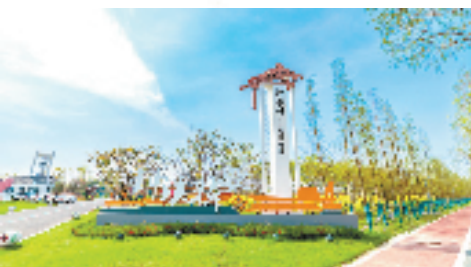
“钟溪棹歌·隐世田园”美丽乡村精品线

可以预见，因“腾笼换鸟 凤凰涅槃”而获得空间留白和动能转换的平湖经开，将迎来高质量发展的更多可能性。