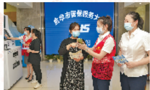
金华医保办人员指导帮助群众用手机办理医保业务

“千团联千村”行动,聚焦强村富民,组建由机关事业单位(含国企)、企业(协会、商会)、村“第一书记”、科技特派员、法律顾问、金融顾问等组成的千个“助村帮帮团”,常态化开展“六送六助”活动(送思路、送政策、送资源、送岗位、送技术、送文化),推动提升结对村造血能力。