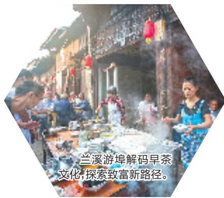
兰溪游埠解码早茶文化,探索致富新路径。

一系列惠民、便民、利民举措,涵盖市民全生命周期,覆盖各类社会群体,有力提升了金华市民的幸福感和获得感、归属感。