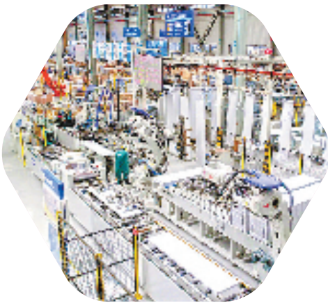
西奥电梯“未来工厂”

方案之一。近日,临平正式发布《大运河国家文化公园(临平段)核心区城市设计及概念设计方案》,进一步明确如何统筹推进大运河文化保护、传承、利用,从而打造出兼具历史文脉和创新活力的城市新地标。