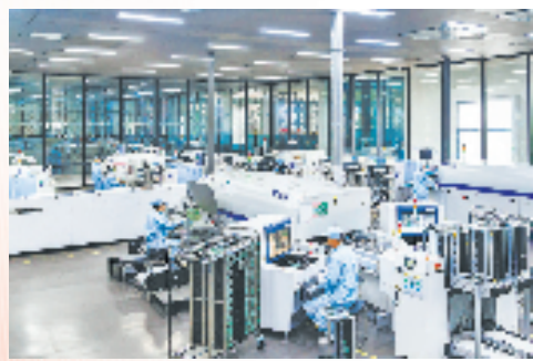
浙江亿利达科技有限公司生产车间

勇当创富带富帮富先锋,浙江国贸锚定“开放强省战略排头兵、金融服务实体经济和防范化解区域风险主力军、健康浙江建设引领者”目标,正以全新的姿态服务全省发展大局,凸显国有资本推动共同富裕的战略功能。