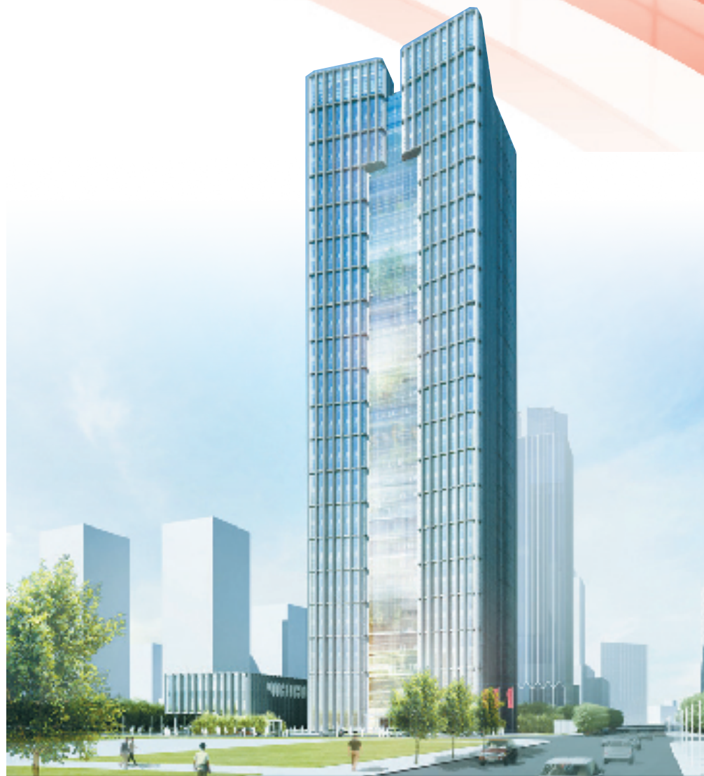
浙江省国际贸易集团有限公司总部大楼效果图

为构建共同富裕生态圈,“链主”企业的实力至关重要。“浙商资产在设立之初就构建以四圈(1+N+F+C)为主要特征的生态圈——股东核心圈、1+N资管平台圈、1+F市场化基金圈、1+C合作伙伴圈,促进各项业务稳定有序发展。”浙商资产相关负责人说。如今,浙商资产的一系列纾困帮扶措施,不但在浙江卓有成效,还复制推广至全国18个省市。