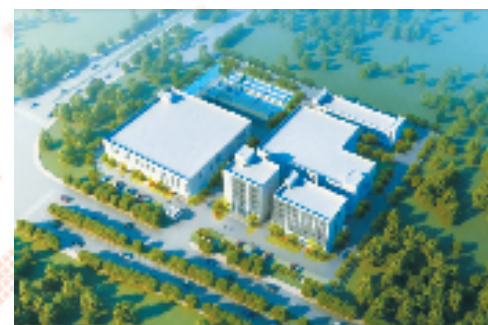
浙江凯胜产品加工有限公司肝素钠生产基地

肝素钠项目、乡村振兴基金、中草药基地……三大产业板块齐发力,探索高质量发展新路子,助力共同富裕新模式,浙江国贸一直在努力。