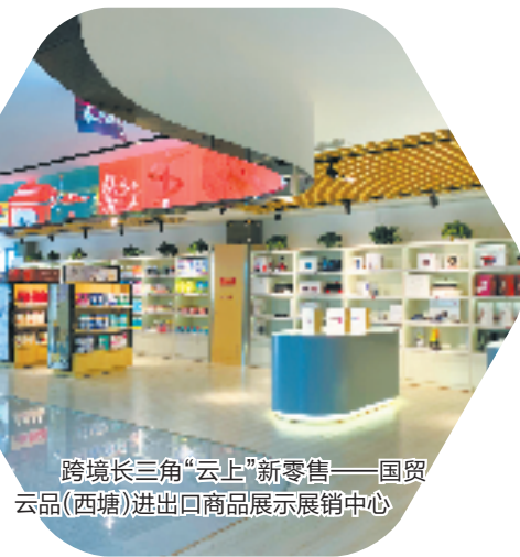
跨境长三角“云上”新零售——国贸云品(西塘)进出口商品展示展销中心

而以浙江东方为主引擎,浙江国贸打造以“大资管”为核心,具有综合金融聚合力、投资管理创新力的一流国有上市金融控股集团。发挥私募股权投资枢纽作用,加大对专精特新中小企业支持,培育扶持省内外企业逾百家,推动20余家企业上市。综合运用“信托+期货+保险”助力共同富裕。浙信信托全面发力家族信托业务,规模突破225亿元。大地期货深耕“保险+期货”,惠及农户超3.6万户。中韩人寿积极开发养老、健康等风险保障产品,为大众提供全生命周期风险管理。