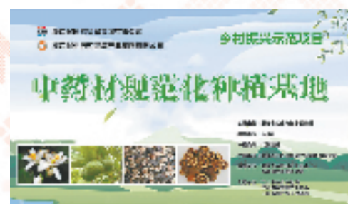
浙江省中医药健康产业集团中药材规范化种植基地