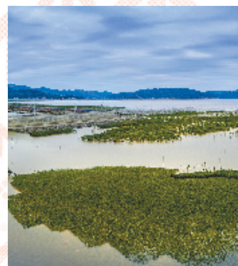
“蓝湾整治”后的温州苍南沿浦湾