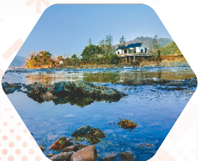
山水林田湖草生态保护修复后的开化县下淤村