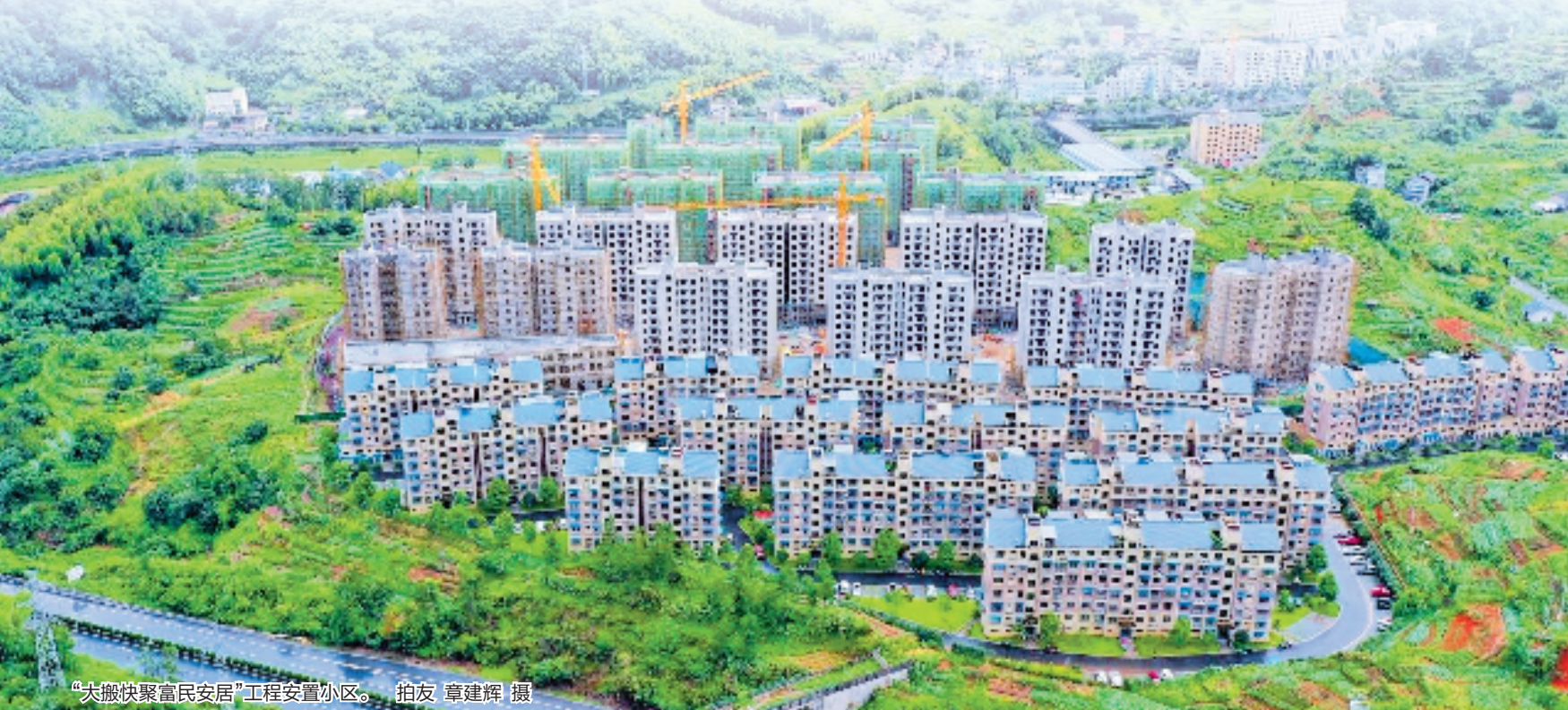
“大搬快聚富民安居”工程安置小区。